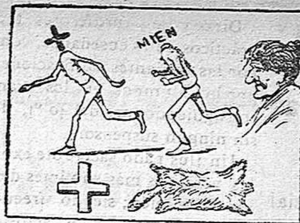
La solución en el próximo número.

Solución á la Charada en acción anterior