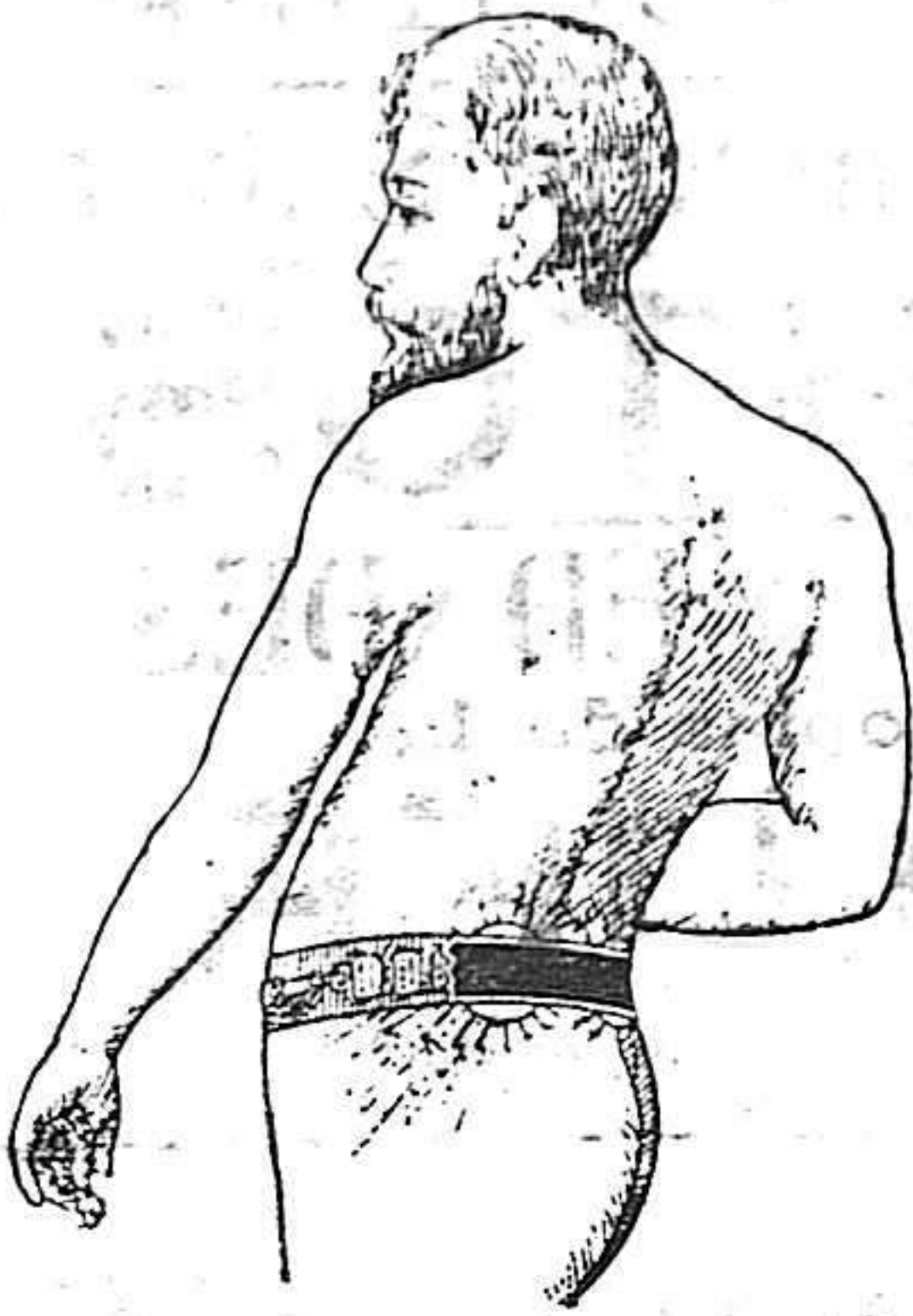
Marca registrada núm. 28.157

Café Puerto Rico: Cajita precintada de 100 gramos a pesetas 0'60 Cajita