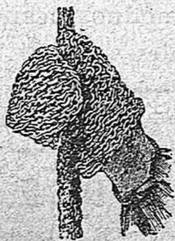
Guante de malla de acero (1).

Otro procedimiento de invierno que ha sido aconsejado, para destruir los insectos, es la sulfurización de las cepas.