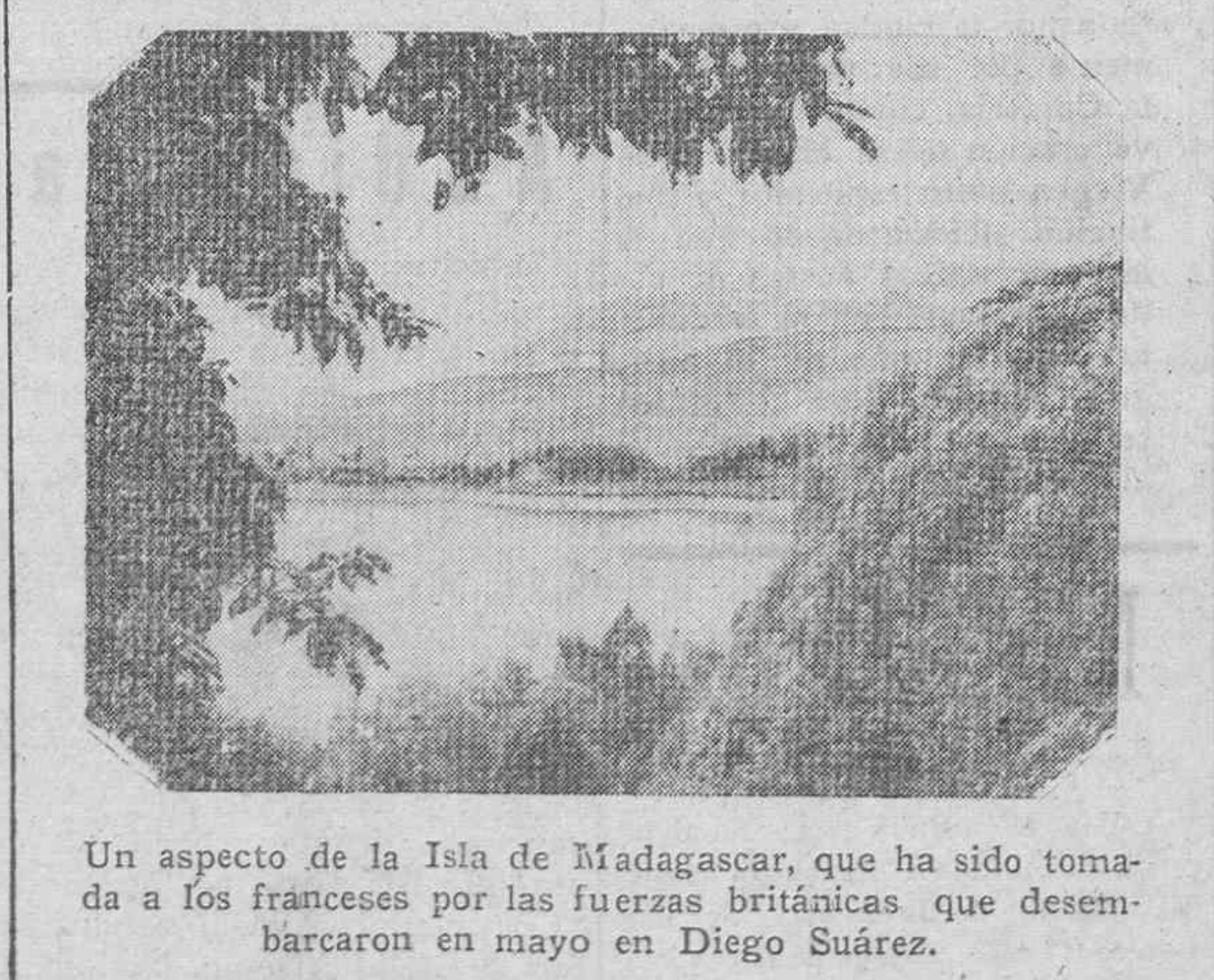
Un aspecto de la Isla de Madagascar, que ha sido tomada a los franceses por las fuerzas británicas que desembarcaron en mayo en Diego Suárez.

En el día de hoy, precisamente, se cumplen los dos años del ataque de los aviones franceses a Gibraltar.—(Cifra).