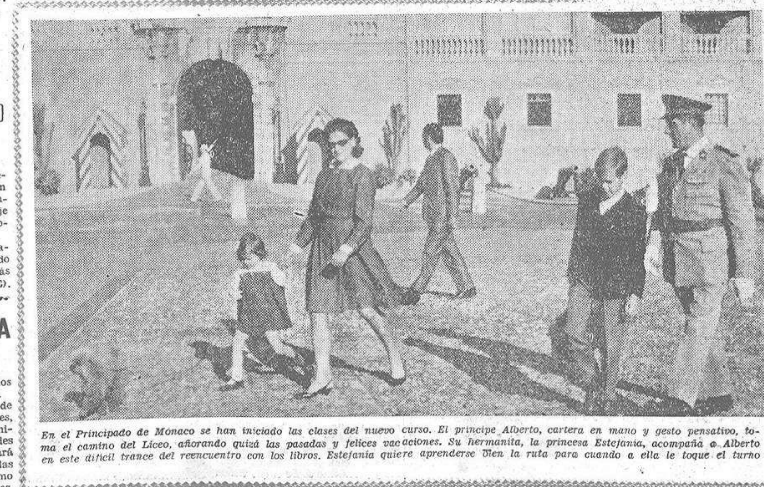
En el Principado de Monaco se han iniciado las clases del nuevo curso. El príncipe Alberto, cartera en mano y gesto pensativo, toma el camino del Liceo, ahorrando quizá las pasadas y felices vacaciones. Su hermanita, la princesa Estefanía, acompaña a Alberto en este díscol trance del reencuentro con los libros. Estefanía quiere aprenderse bien la ruta para cuando a ella le toque el turno

del Marqués. Durante las dos jornadas se cobraron cerca de cuatro mil perdices, ayer y hoy, en la mil piezas. Acompañaron al Caudillo, don José Solís Ruiz, director general de Colonización, y otras personalidades. A las cinco de la tarde, S. E. el Jefe del Estado emprendió el viaje de regreso a Madrid.—(CFRA).