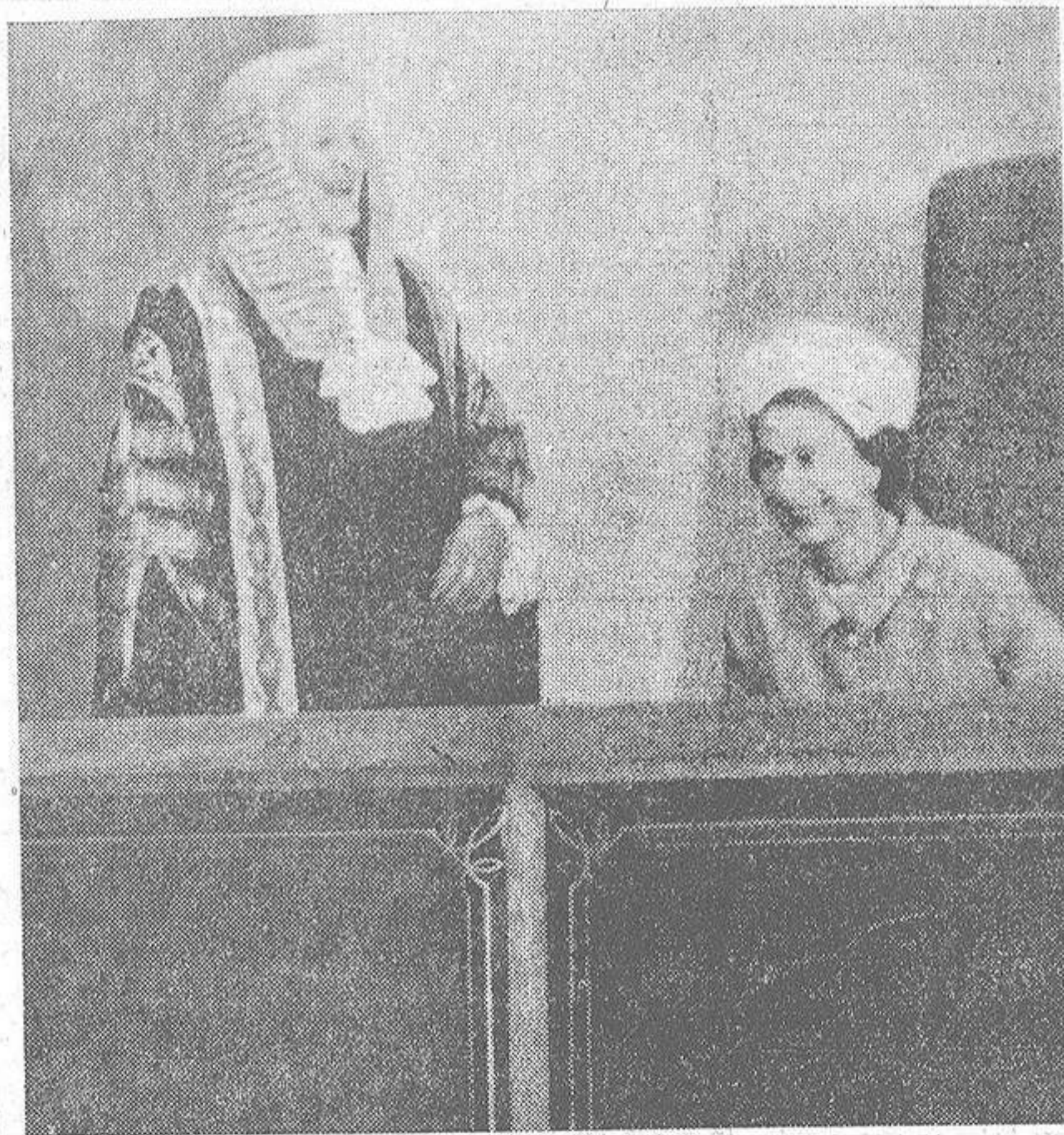
Sucedió en el solemnisimo acto de apertura del año judicial en el Tribunal Supremo de Inglaterra. El protocolo, naturalmente, debiera haber sido el de siempre: discurso de bienvenida, pronunciado por el Lord Canciller, y contestación a cargo de la soberana. Isabel de Inglaterra. Pero las cosas no salieron conforme a lo previsto, y el díscol momento fue salvado con una hábil sonrisa de la Reina, que provocó una sonora carcajada de relajamiento nervioso en el honorable Lord Gardner