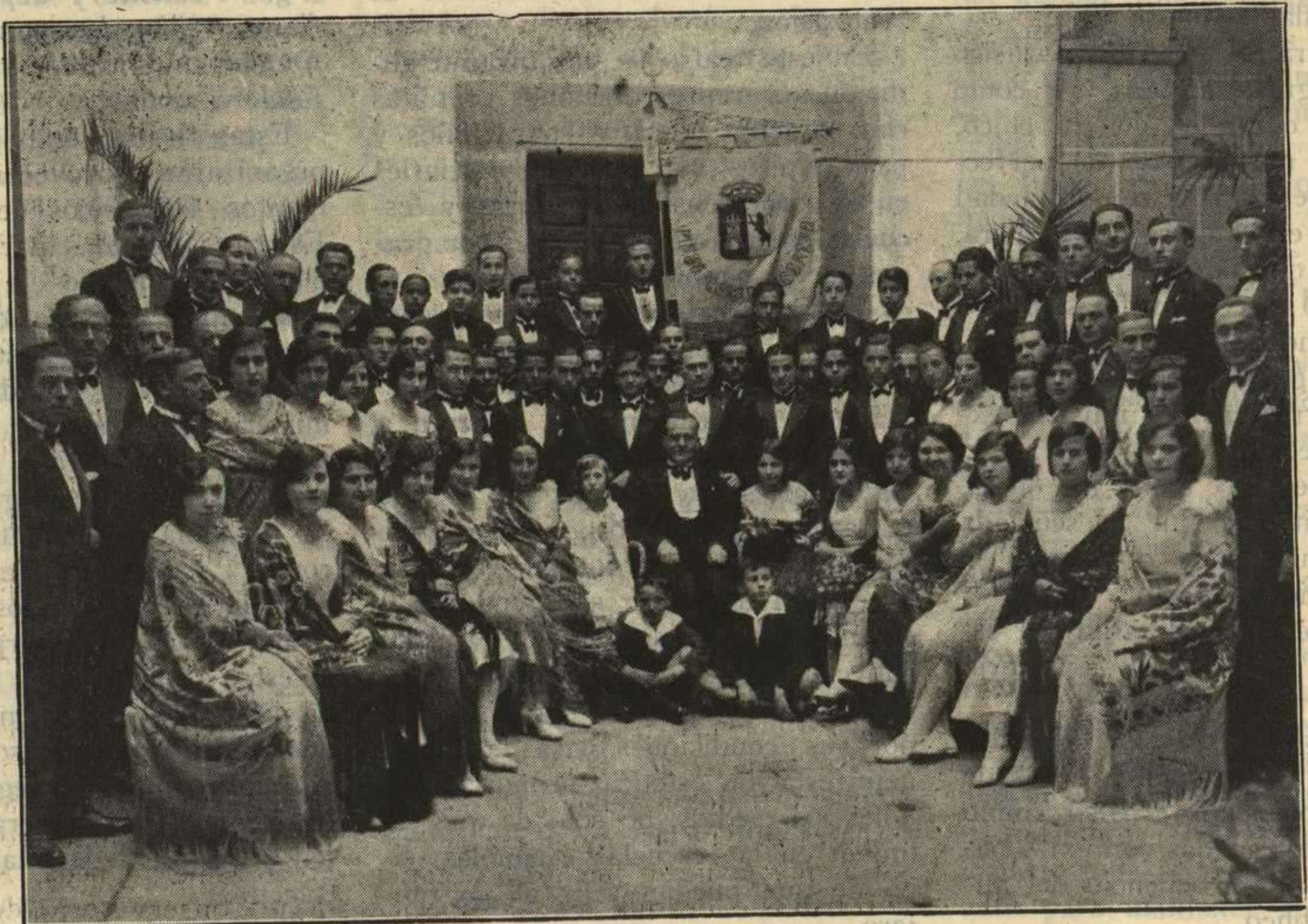
LA MASA CORAL CACERENA

La Junta, al desplegar sus planes, que abarcan enteramente la vida musical de la nación, designará Comisiones técnicas compuestas por personas especializadas en cada sector del arte, compositores sinfónicos