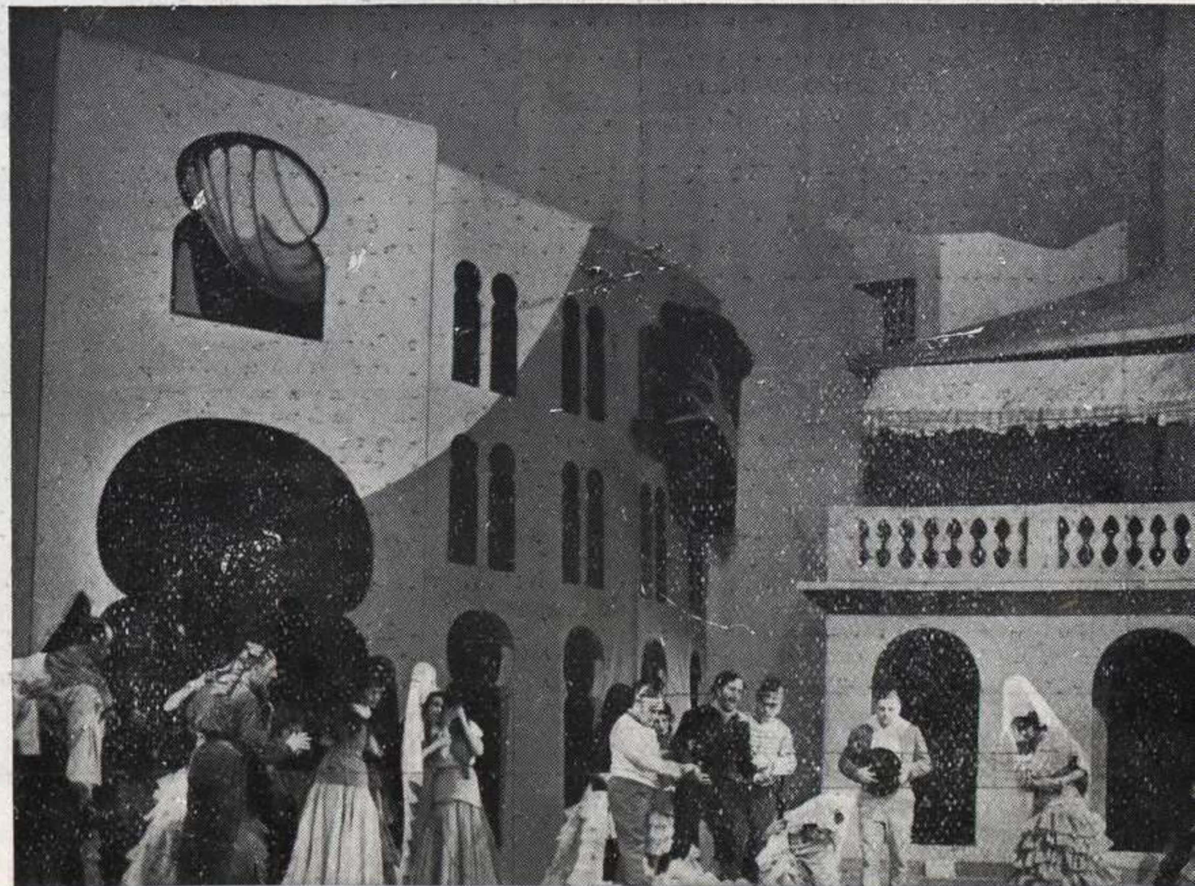
Así se ha representado Carmen, de Bizet, recientemente en Londres.

Ha sido elegido académico de la de Bellas Artes de San Fernando el musicólogo don