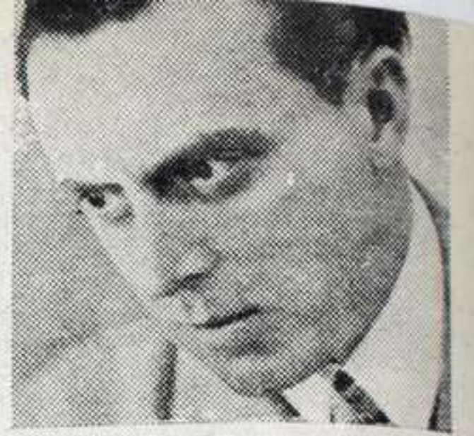
LEOPOLDO QUEROL pianista español