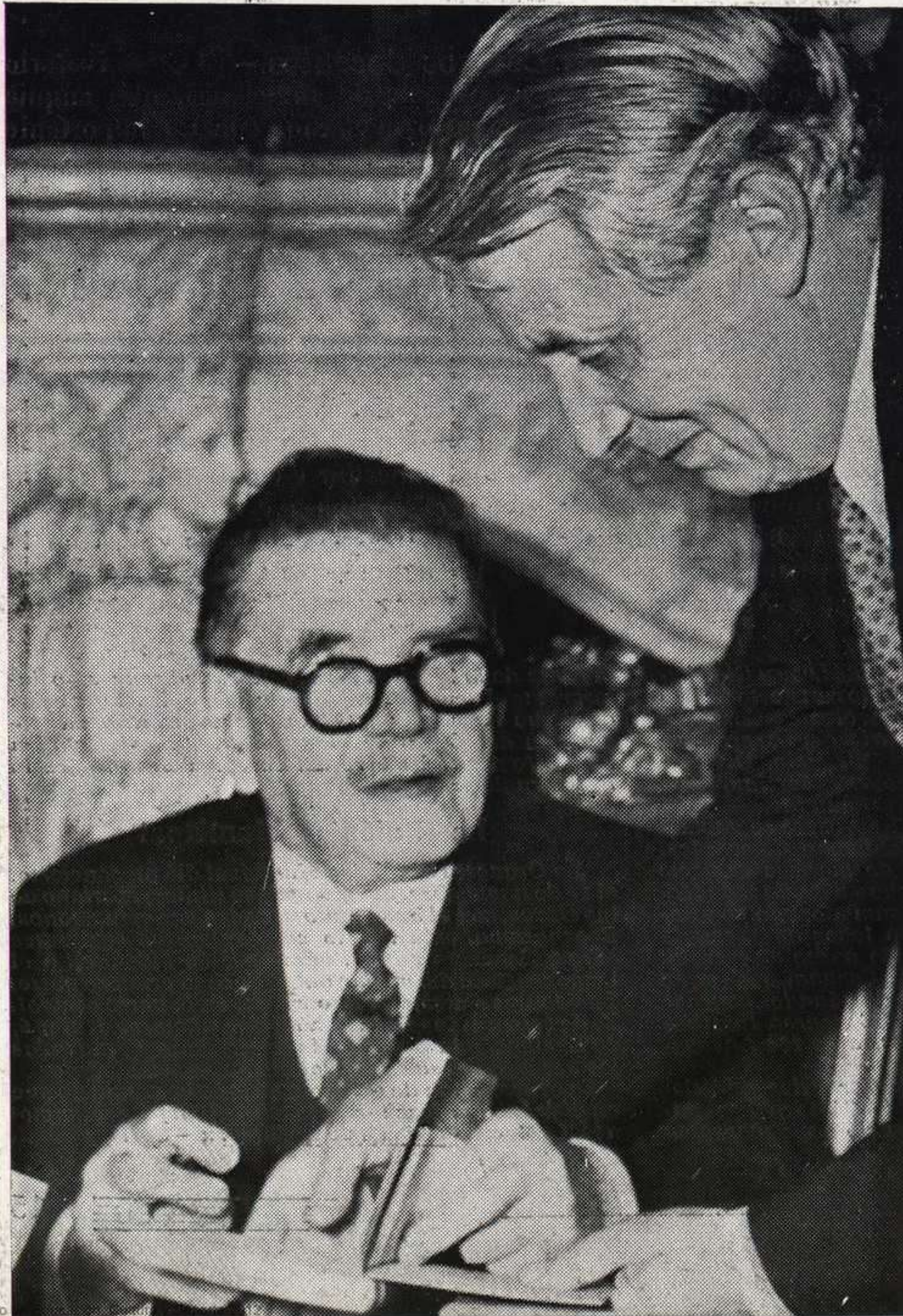
Auriol, Gran Premio del Disco, dedicando una de sus últimas obras a uno de los más célebres directores de orquesta franceses.

La inauguración del Curso 1952-53 ha estado a cargo de la agrupación italiana.