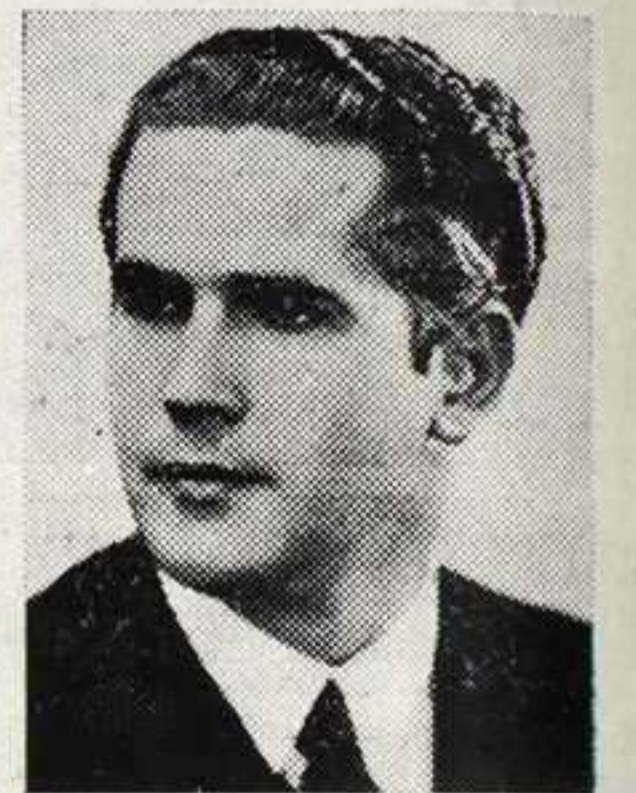
RAFAEL SEBASTIÁ pianista español