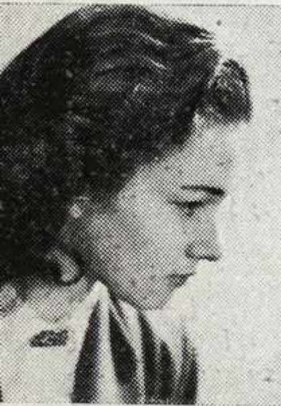
JANINE KINET pianista belga