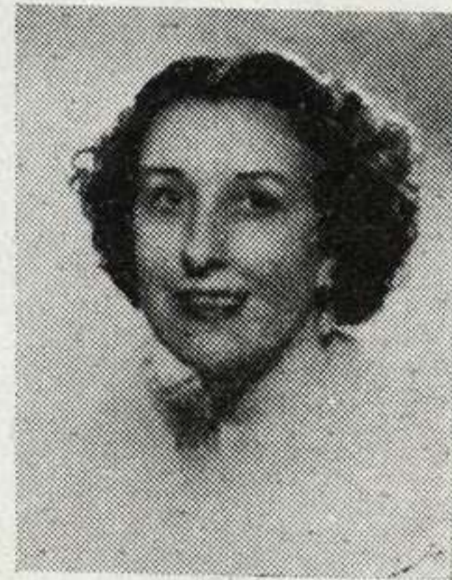
ANITA REULL cantante australiana