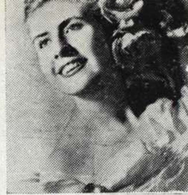
MARIMI DEL POZO cantante española