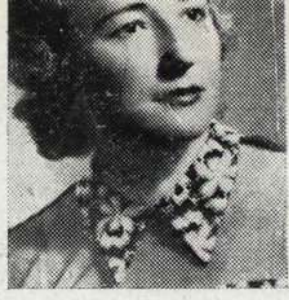
GERTRUD HAUNSCHILD cantante alemana