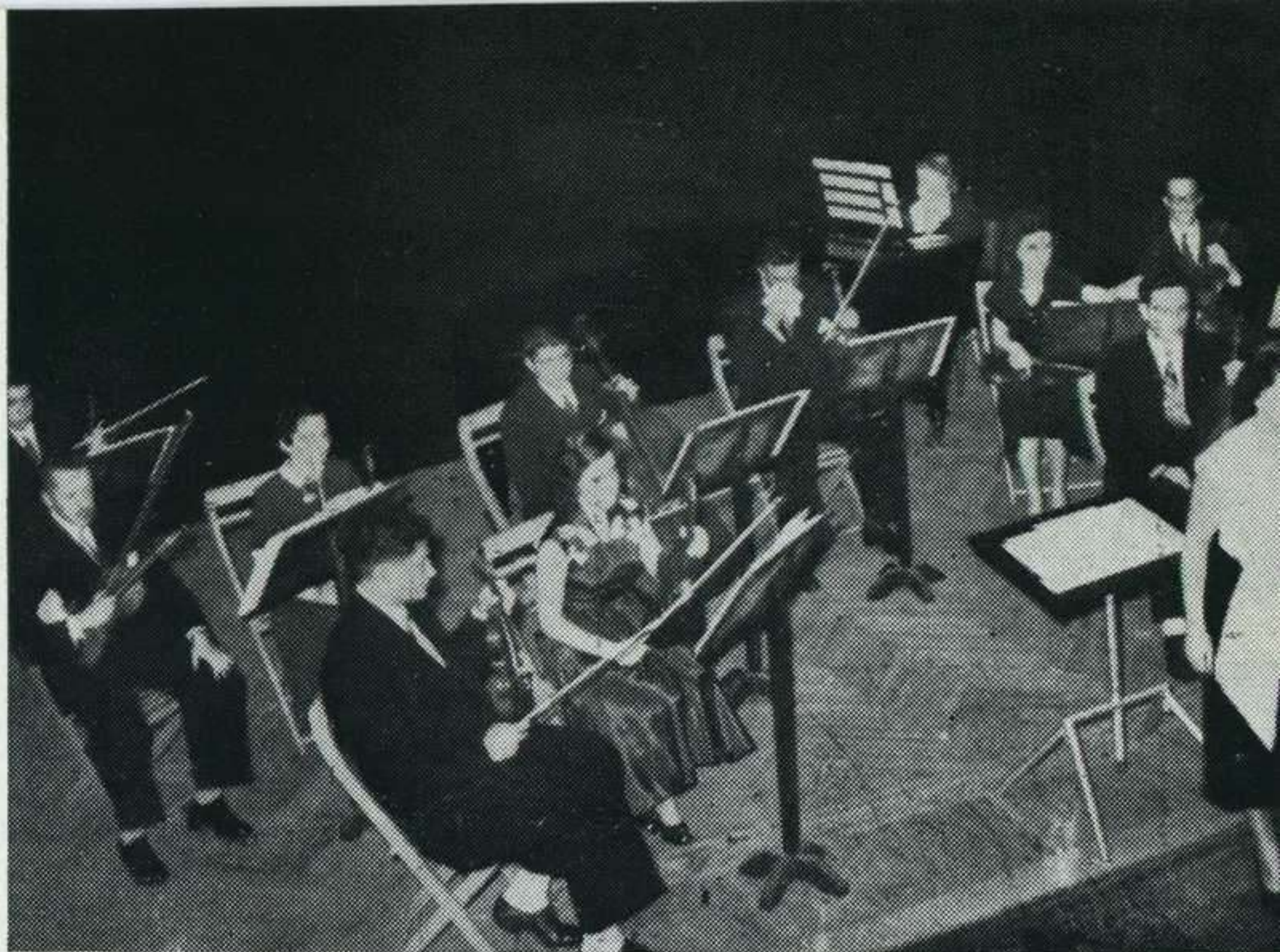
Orquesta de Cámara Anfión

Como desinfección después de tal inmersión en el fango, la sangre y el ruido, vino en maravilloso baño de luz espiritual la mencionada Misa de Beethoven, que hubiera requerido intérpretes más identificados con el autor. Además, en breve temporada de primavera y mientras se ensaya, para terminar, el Requiem de Mozart—digno «pendant»—, se ofrecen el bellísimo «cuencito» infantil, de Humperdinck, Hänsel y Gretel , y la popular Traviata verdiana. Así va a cerrar las puertas el Colón este año, y el maestro Calusio, que muy poco pudo hacer a causa de su tardío nombramiento, renuncia como director general, cuando se esperaba mucho de él en lo futuro. Es una lamentable pérdida. Le reemplaza el maestro Pedro Fermi Valenti Costa, también muy estimado en nuestro medio artístico.