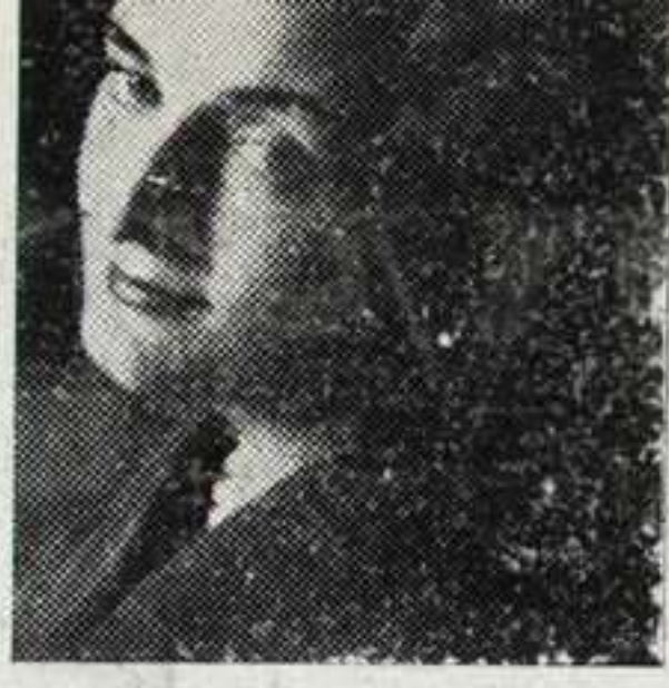
JULIETTE BISE cantante suiza