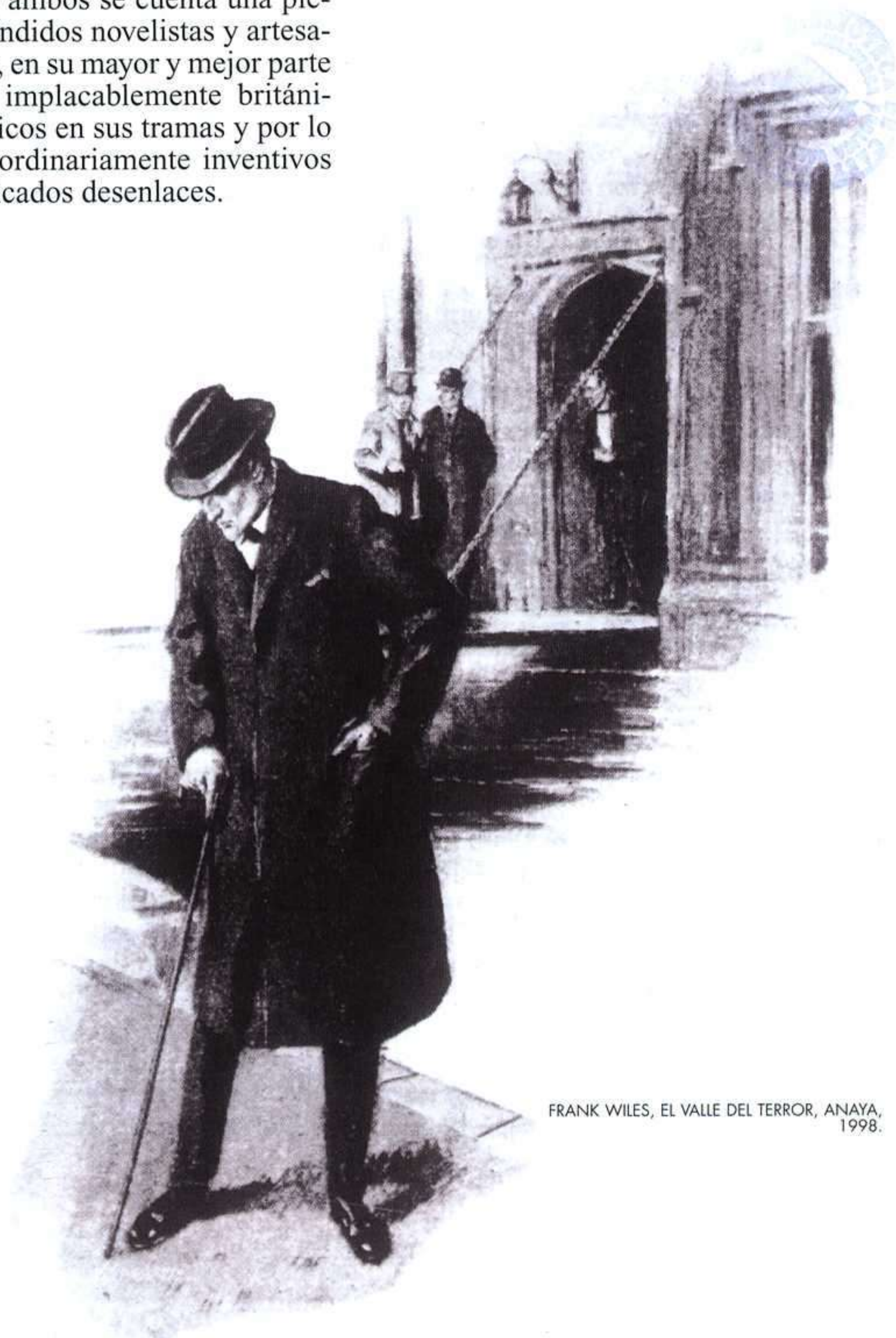
FRANK WILES, EL VALLE DEL TERROR, ANAYA, 1998.

La aventura holmesiana de El valle del terror comienza con el detective cómodamente instalado divagando en sus habitaciones en Baker Street y casi de repente ya está viajando hacia la campiña inglesa. Esa campiña por la que vagan domésticas serpientes asesinas, inválidos y monstruosos veteranos de las guerras hindúes, vengativos hidalgos, aristócratas crueles, marinos retirados que ocultan terribles secretos, sabuesos infernales, extravagantes ciclistas solitarias, arriesgadas institutrices de pelo cobrizo, y siempre el lado raro de la vida, el crimen oculto tras un verde prado y una casona respetable. En El valle del terror , Holmes y Watson viajan al corazón de Sussex, donde les aguarda un crimen imposible cometido en un lugar cerrado, en el caso de autos una especie de castillo menor cuyo solar se erigió en