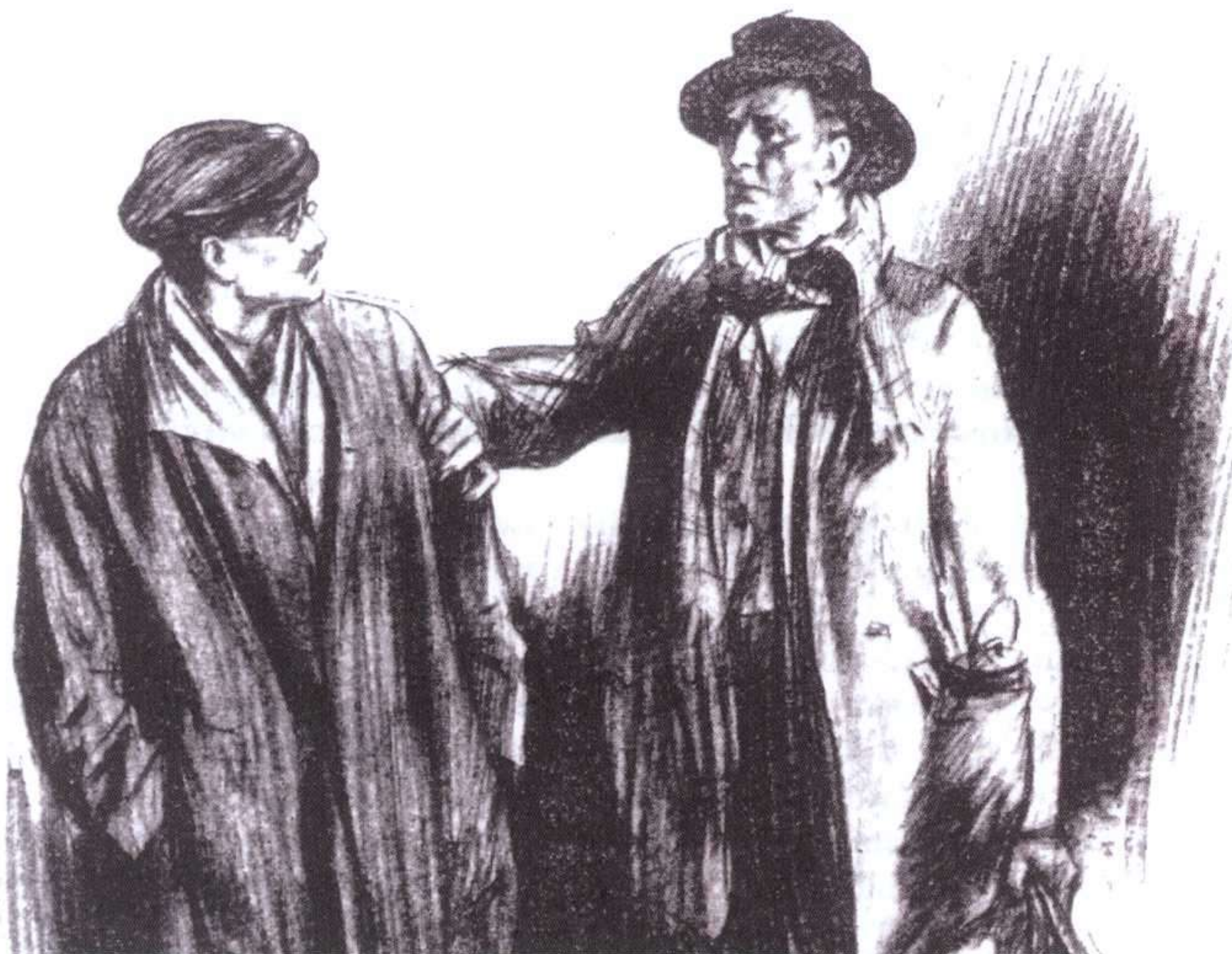
FRANK WILES, EL VALLE DEL TERROR, ANAYA, 1998.

Pero cuando la acción, las malas nuevas que llegan de Birlstone, le obligan a trasladarse a ese confín de Sussex no lejos de las fronteras de Kent, reaparece todo el estilo y el aroma de las aventuras rurales de Holmes y Watson. El sencillo pero muy eficaz estilo narrativo de Conan Doyle atrapa con pocos trazos el paisaje y la historia del escenario. Su manera de presentar el problema de la