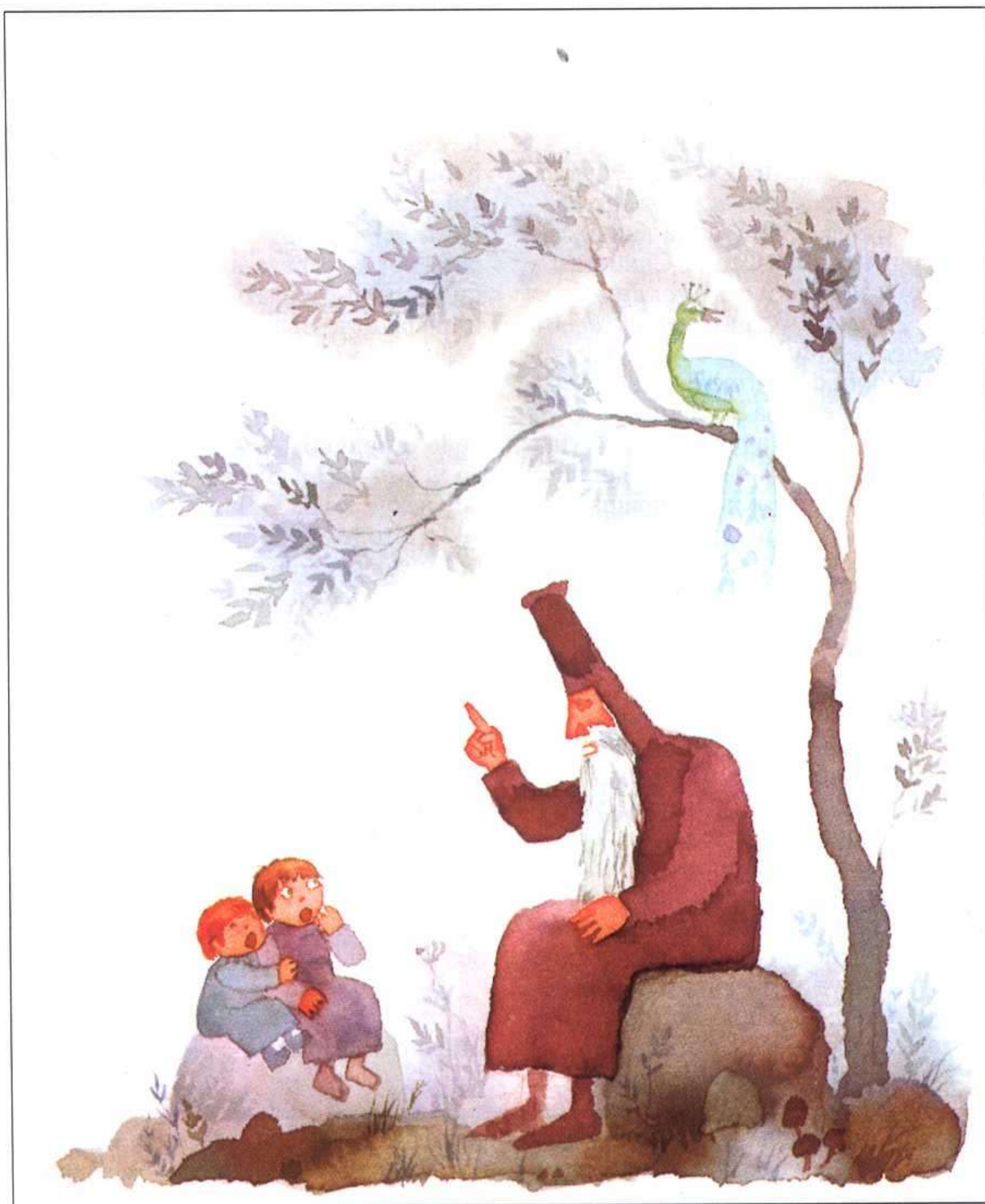
ARCADIO LOBATO, EL VALLE DE LA NIEBLA, SM, 1987.

En un remoto lugar existe un hermoso valle en el que jamás levanta la niebla. Sus habitantes no conocen el sol ni la luna, y creen que no hay nada más bonito que su país, que no hay nada fuera del valle; y así se escribe la historia de generación en generación. Sólo un viejo científico, al que destierran por loco, sostiene que más allá de las montañas hay un mundo lleno de color. Esteban, su nieto, le cree y por amor a su abuelo viaja para comprobarlo. Atraviesa un bosque y otros peligros, se eleva por en-