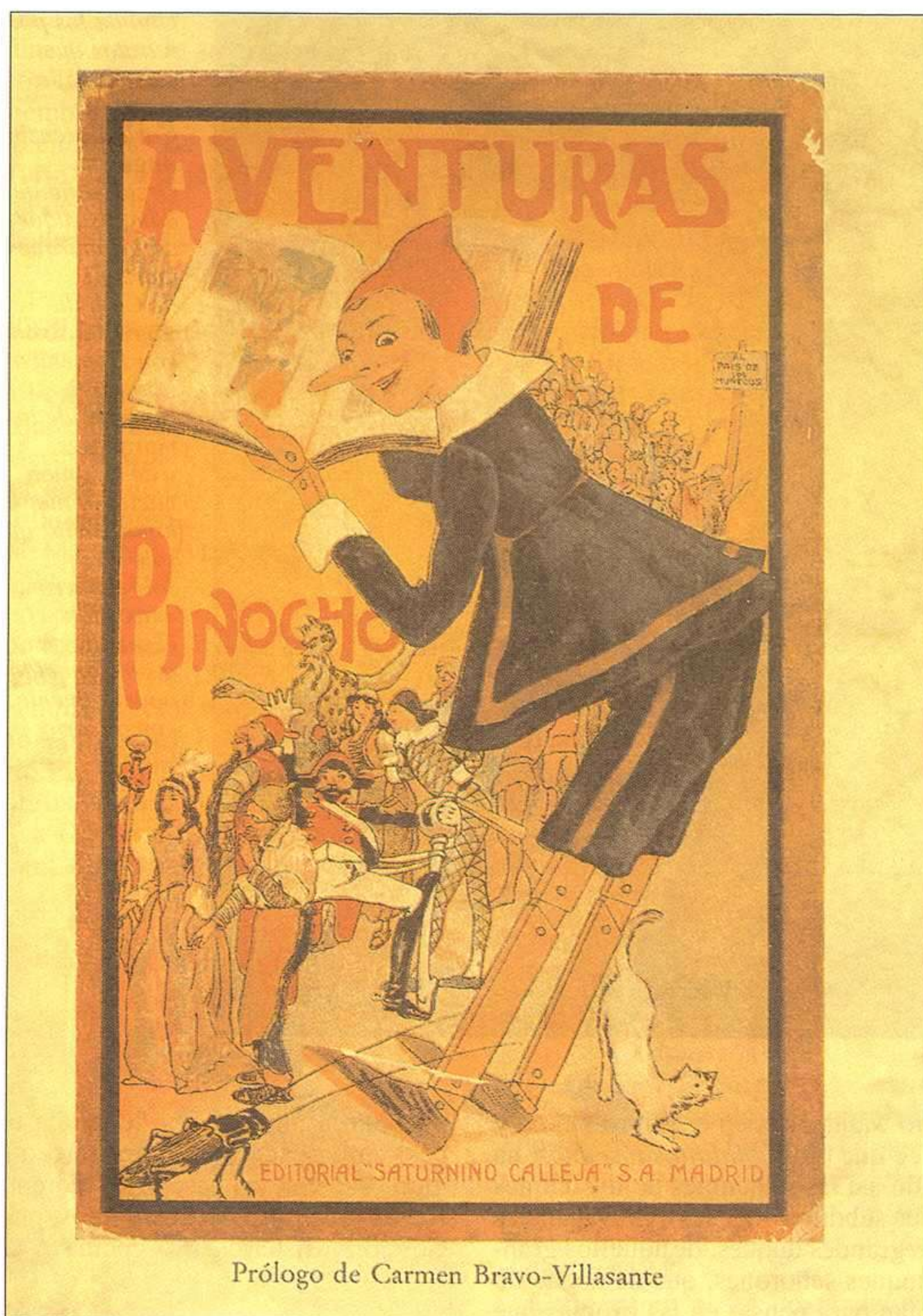
Prólogo de Carmen Bravo-Villasante

La unificación de Italia y el cambio de política le proporcionan a Collodi nuevos menesteres. En 1860 lo encontramos formando parte de la comisión de censura teatral, labor que desempeña con gran acierto, a juzgar por los elogios del ministro del Interior. Ese mismo año resucita Il Lampione , y dos años después figura como director escénico del teatro La Pergola. En el 64 lo nombran secretario de segunda en la prefectura de Flo-