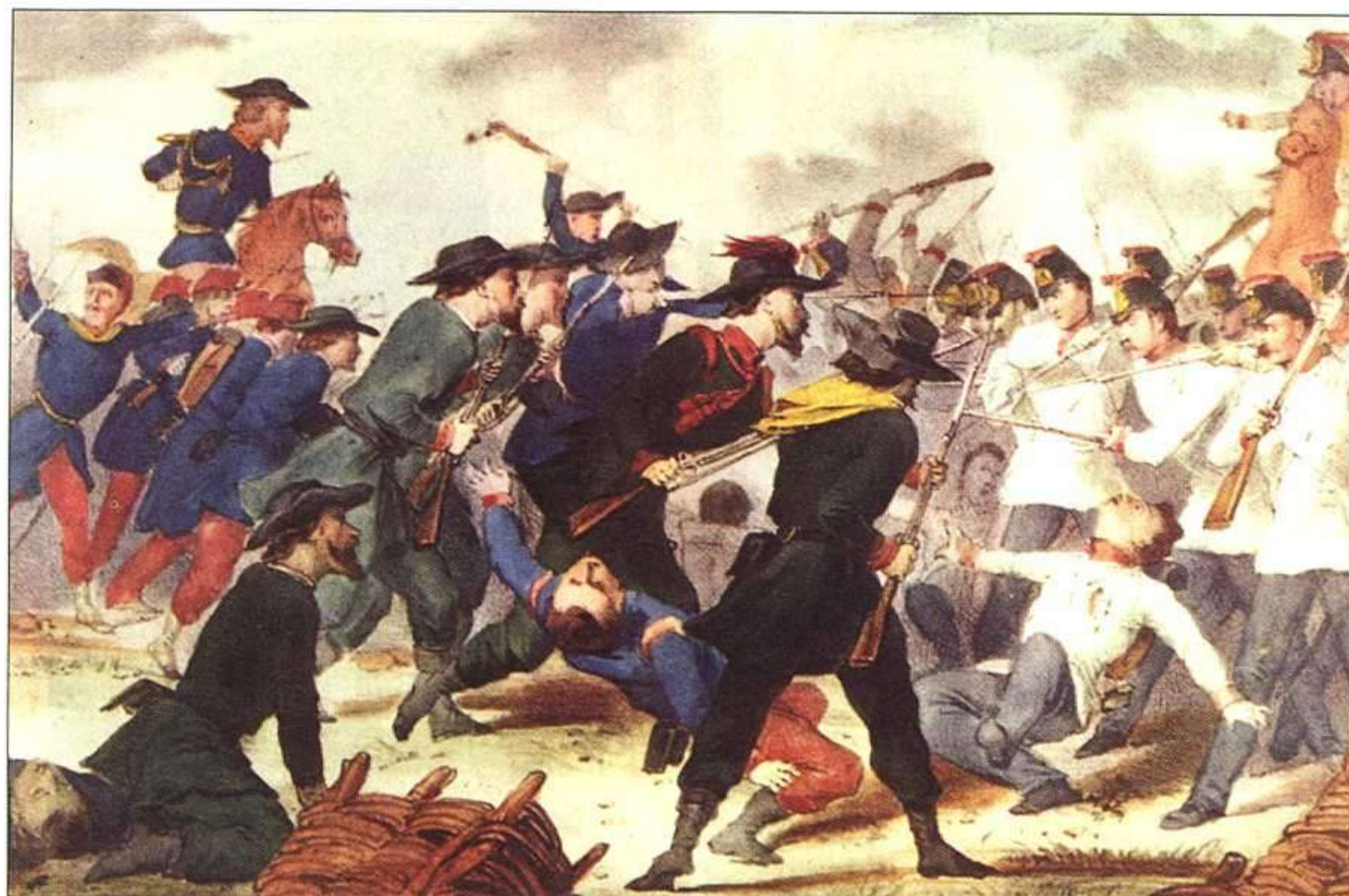
Arriba, pintura que recoge la batalla de Varese, con los austriacos y los soldados de Garibaldi enfrentados. Al lado, un retrato del papa Pio IX, elegido en 1846, tras la muerte de Gregorio XVI. Pio IX tenía fama de liberal y reformador, e inició su pontificado con una amnistía política.

se convenció de que el sectarismo y el complicado ritual ocultista de la sociedad no conducía a ningún sitio, decidió crear una nueva organización. En dos meses de intensa actividad la «Joven Italia» estaba en marcha: a los objetivos habituales de libertad e independencia, Mazzini añadió uno no menos importante: «unidad». Su primer intento de pasar a la «acción» lo dirigió contra Carlos Alberto, pero la imprevisión, la traición y su desmedida confianza en que la «chispa» que él lanzara incendiaría a Italia —que él creía un «volcán»— condenaron la intentona al fracaso casi antes de ser puesta en práctica. Hubo un joven conspirador que consiguió escapar por los pelos: Giuseppe Garibaldi.