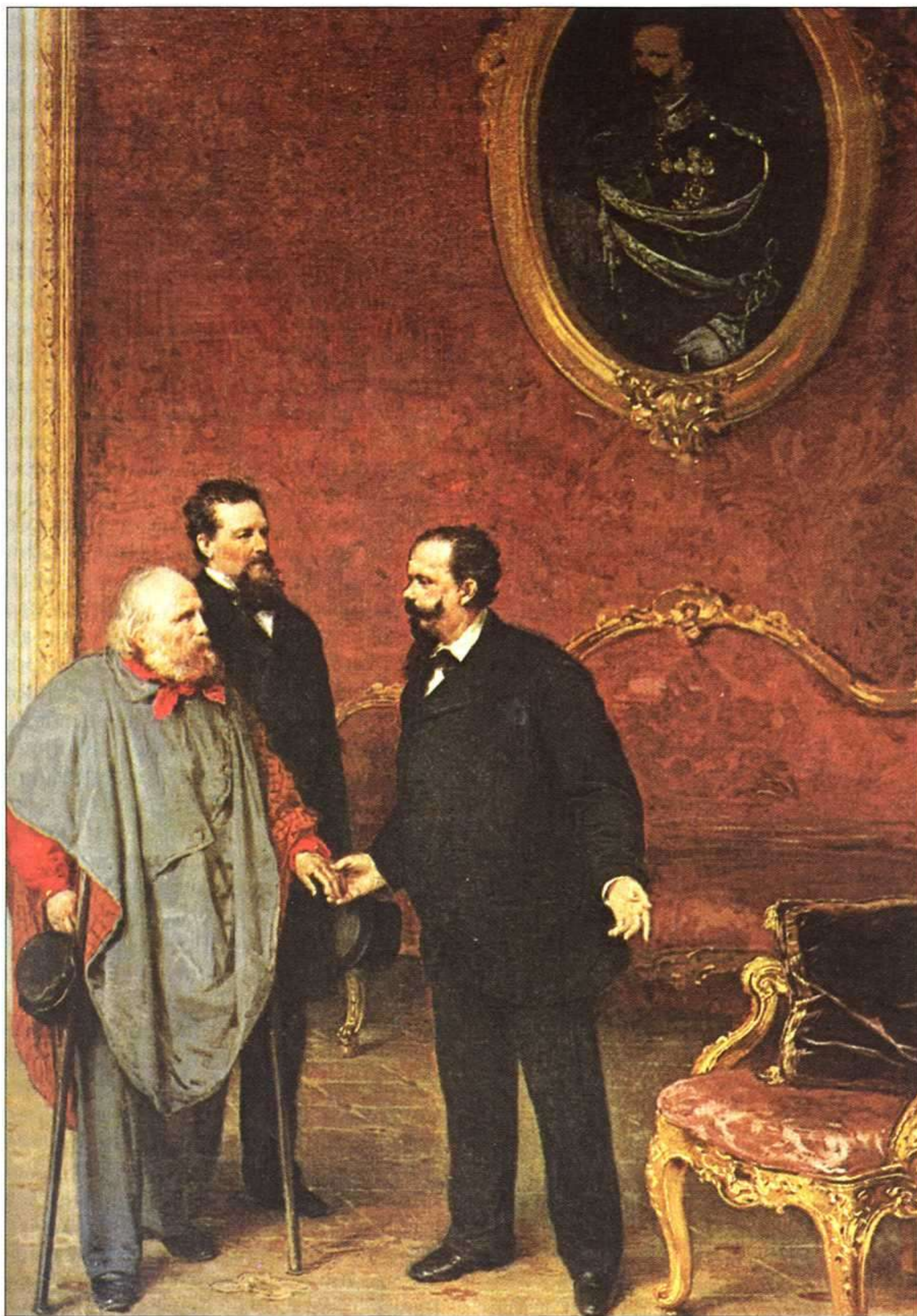
Un Garibaldi ya mayor es recibido por Víctor Manuel II, rey de Italia, en su residencia del Quirinal. Era enero de 1875, y el reino de Italia había nacido oficialmente en 1861.

llegó a Nápoles en un desfile triunfal, negándose a anexionarla mientras no llegara a Roma. Víctor Manuel decidió salirle al paso. Avanzó hacia el sur y derrotó a los ejércitos pontificios en Castelfidardo, mientras Garibaldi des-