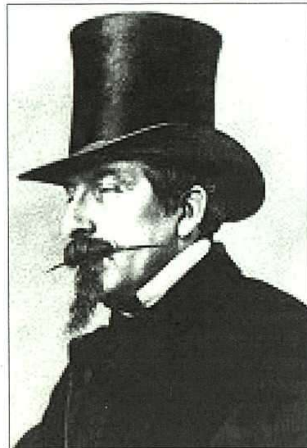
Tres hombres clave en la historia de la Italia del XIX: el ministro Cavour (arriba a la izquierda); a su lado, Napoleón III retratado por el famoso fotógrafo francés, Nadar; y Giuseppe Mazzini, jefe del trinvirato de la República de Roma.

dujo entre 1820 y 1831 en una serie de rebeliones y movimientos revolucionarios, atizados por las sociedades secretas, que, fundadas por hombres salidos de la burguesía media, fueron a la vez su causa y efecto. Pero el Congreso de Viena había dejado a Italia prácticamente a merced de Austria, y Metternich —ministro de Asuntos Exteriores hasta 1821 y luego canciller imperial de Austria—