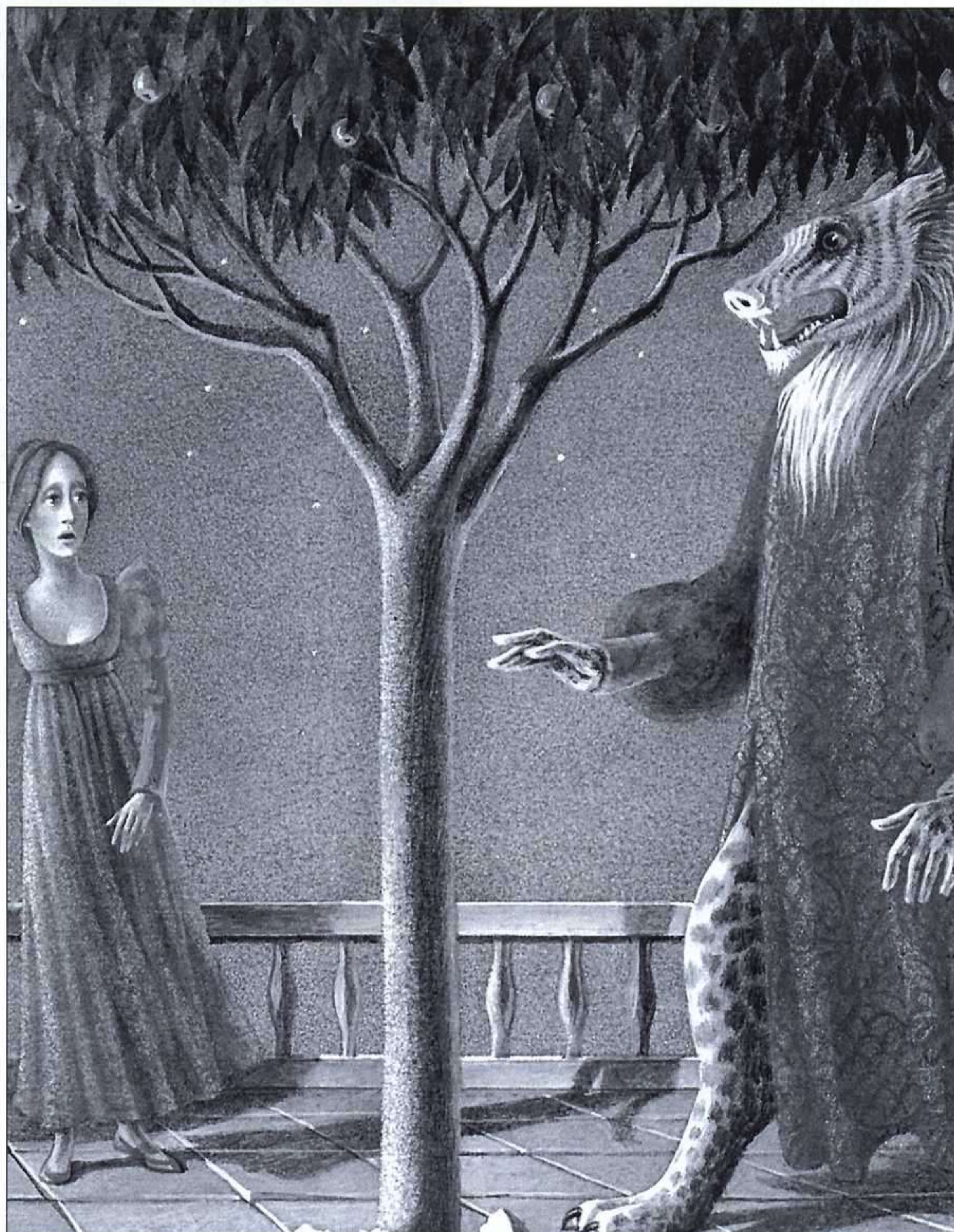
BINETTE SCHROEDER, LA BELLA Y LA BESTIA, LUMEN, 1990.

La belleza solicitada por el criterio estético de la época, es, en gran medida,