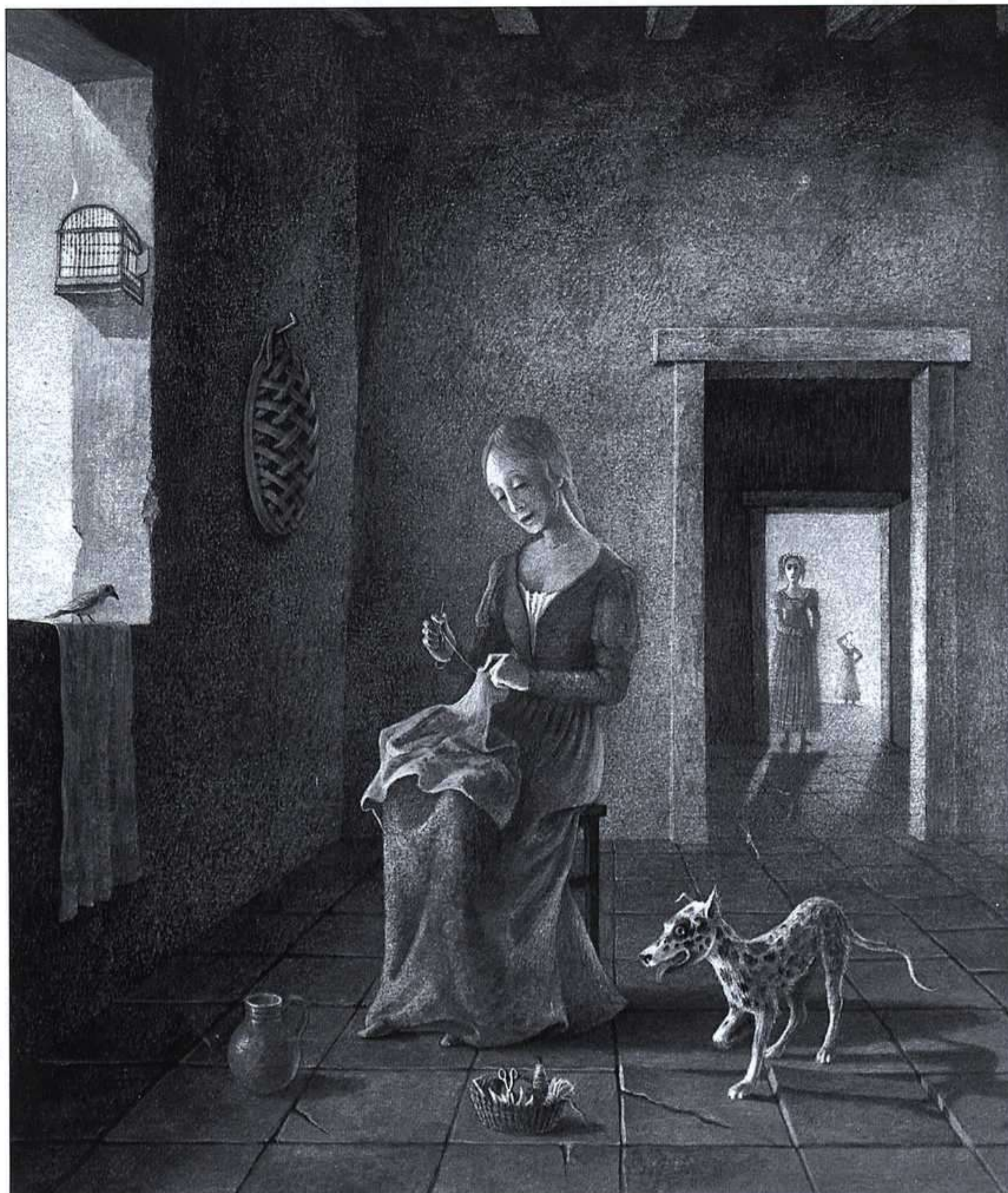
BINETTE SCHROEDER, LA BELLA Y LA BESTIA, LUMEN, 1990.

El arte, desde sus más tempranas manifestaciones, ha creado «modelos de valor» para el hombre y «modelos de belleza» para la mujer. Ambos debían adaptarse en la medida de lo posible a esa «perfección» establecida para ser admitidos en su grupo social. Un cuento como La Bella y la Bestia es modélico en este sentido. Bella resume en sí misma el paradigma de aquello que ha de ser una mujer para triunfar: bella, dócil y honesta y con resignación a prueba de obstáculos.