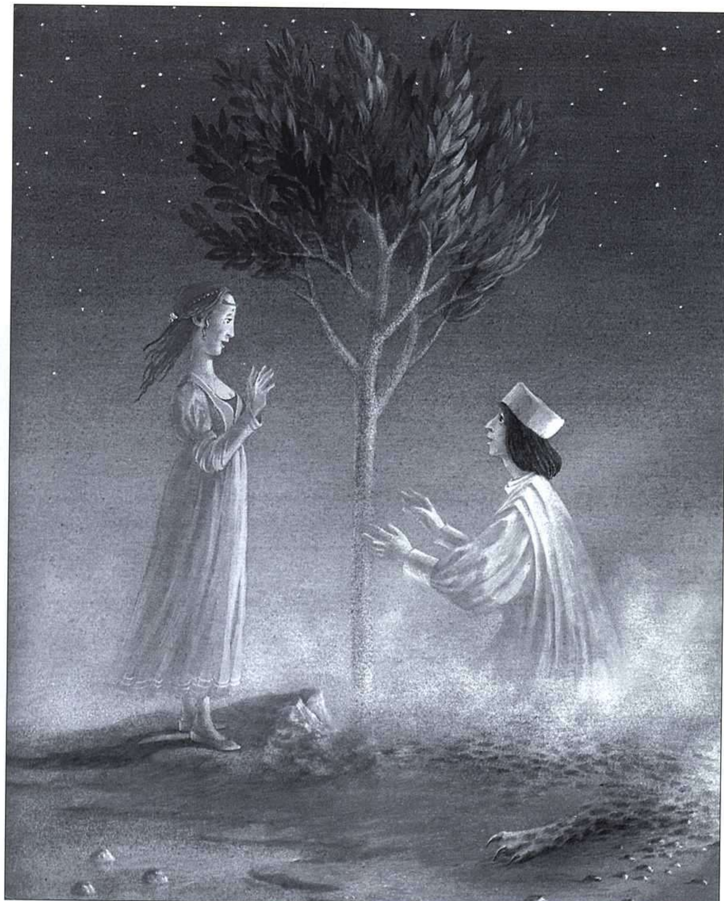
BINETTE SCHROEDER, LA BELLA Y LA BESTIA, LUMEN, 1990.

En el siglo XIX, siglo misógino por excelencia, los hombres parecen descubrir que las mujeres han aprendido la lección y los han convertido en esclavos de sus