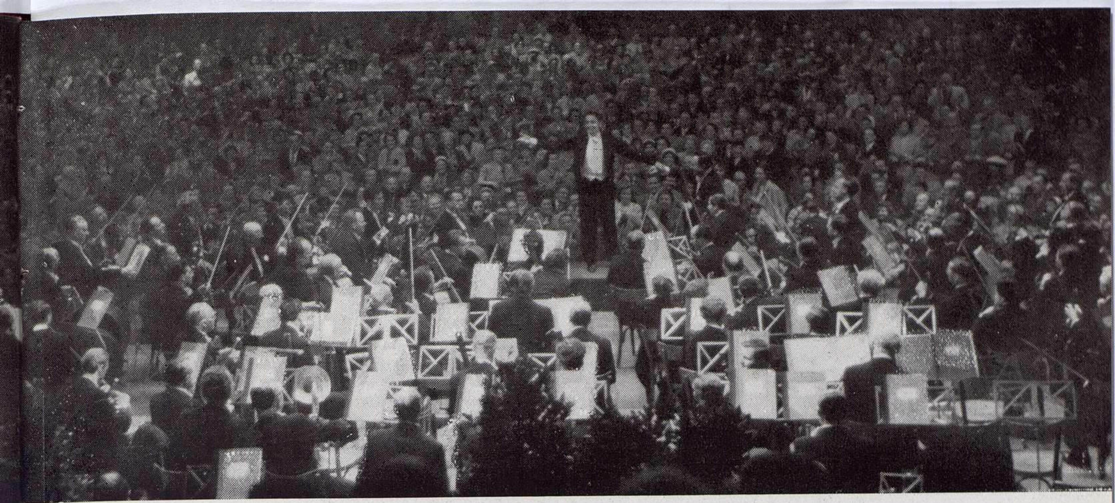
La Orquesta Filarmónica de Berlín, con von Karajan al frente, es escuchada por miles de filarmónicos.

La Orquesta de Hamburgo (Hamburgisches Staatsorchester), bajo la dirección de Josep Keilberth y los maestros Ludwig y Scherchen, dará en la presente temporada doce conciertos filarmónicos y dos conciertos especiales con corales de Brahms y de Bach. El programa ofrece, junto a obras principalmente clásicas, las siguientes obras contemporáneas: Sutermeister, Concierto para violoncelo ; Hindemith, La alemanda de los cisnes ; Strawinsky, Divertimento ; Thärichen, Concierto para tambores y orquesta ; Janacek, Misa solemne ; Schönberg, Primera sinfonía de cámara ; Hartmann, Primera sinfonía , y el estreno en Alemania de los Estudios para orquesta de cuerda , de Martin.