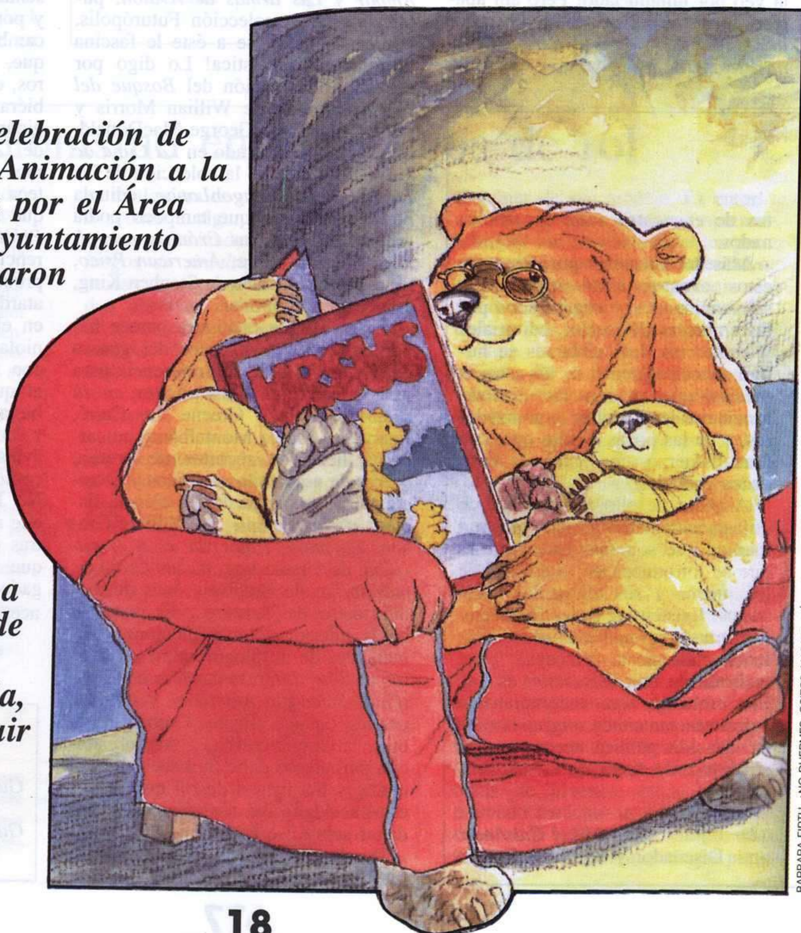
BARBARA FIRTH, ¿NO DUERMES, OSITO?, MADRID: KÓKINOS, 1994.

Con motivo de la celebración de la VI Campaña de Animación a la Lectura, organizada por el Área de Educación del Ayuntamiento de Orense, se realizaron unos cursos de formación dirigidos a padres y madres, sobre el tratamiento de la lectura en el hogar. La buena acogida de esta iniciativa animó al equipo organizador a elaborar una serie de orientaciones, dirigidas a la familia, sobre cómo contribuir a crear el hábito lector en los niños, que recogemos en este artículo.