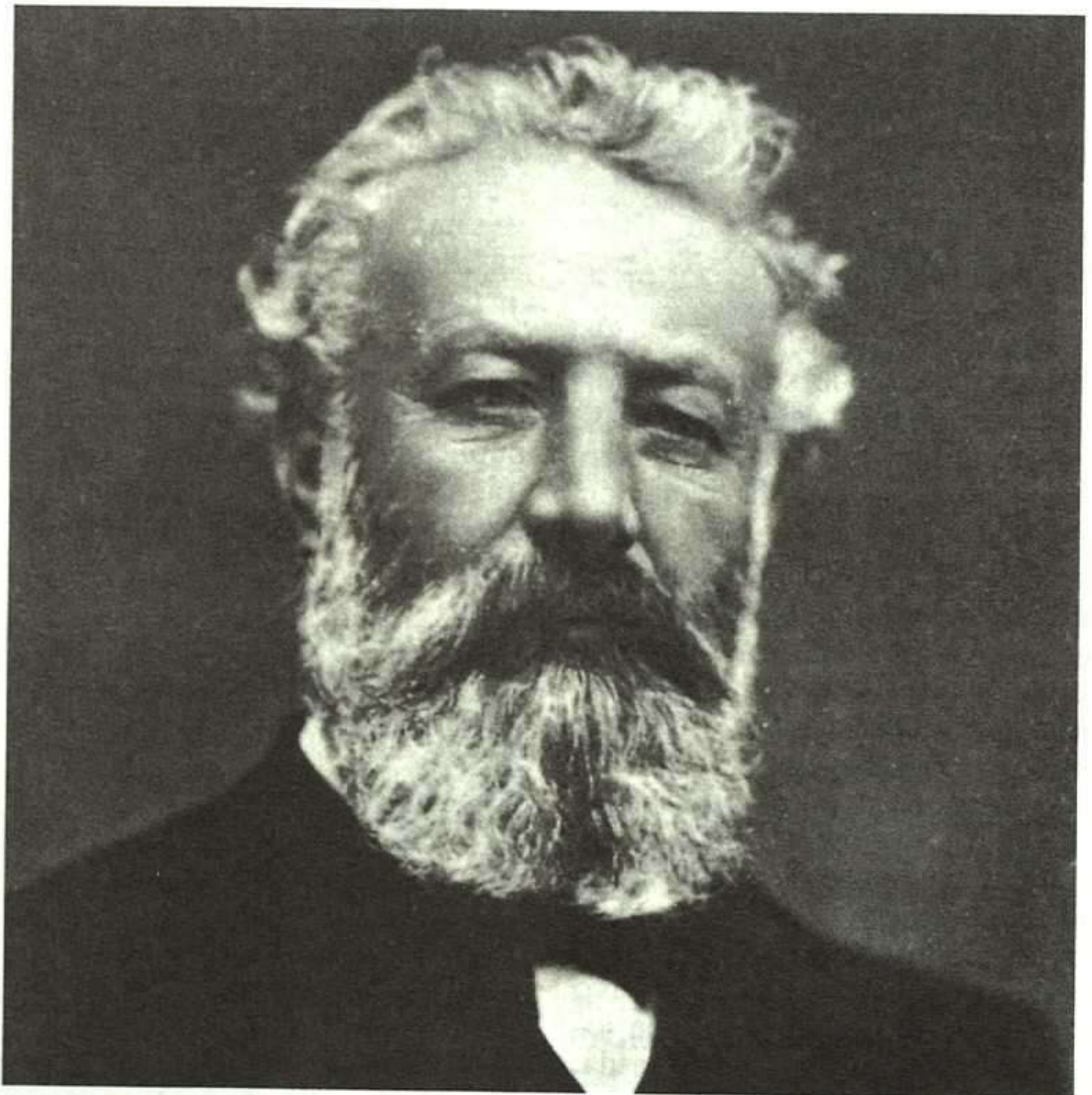
Foto de Jules Verne, hecha por su amigo Nadar.

El ambiente marinero de su ciudad natal, el recuerdo de sus an-