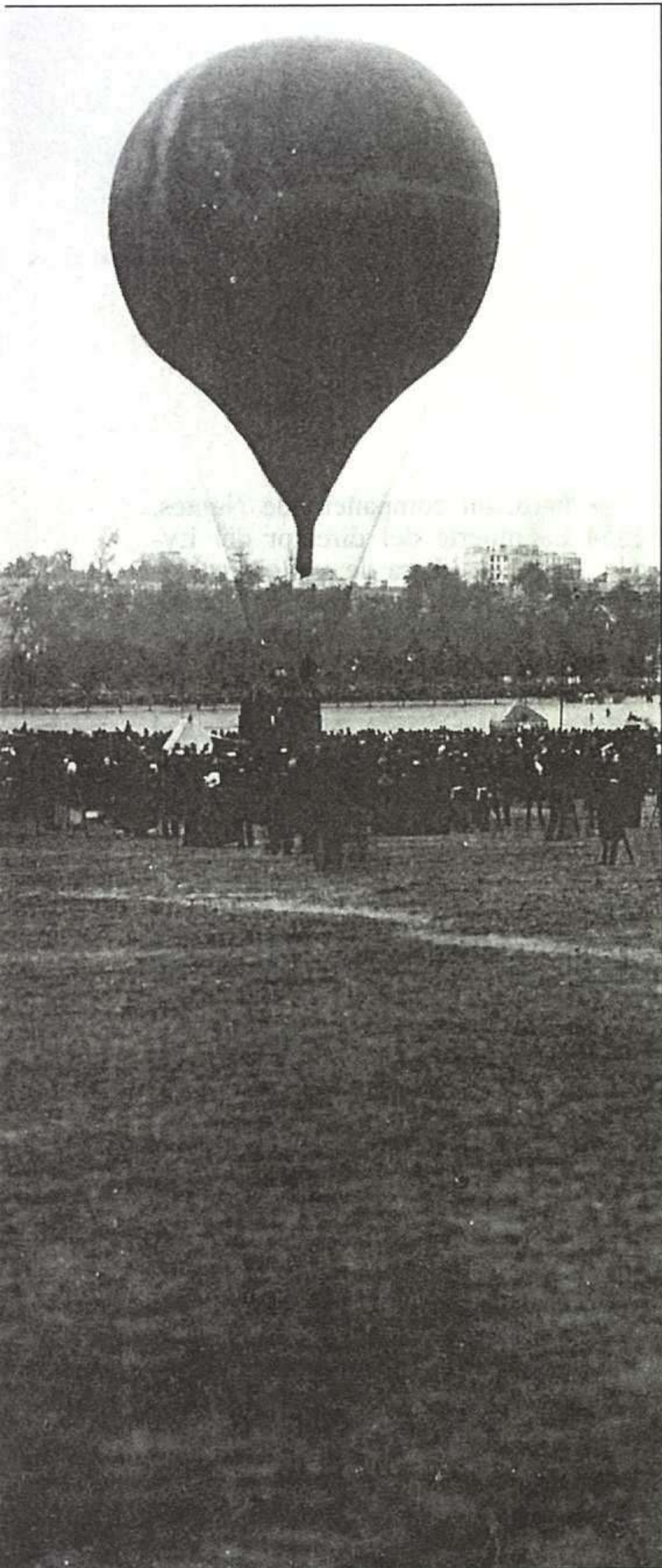
El globo Le Géant de Nadar inicia su travesía en octubre de 1863.

se de Viane, una viuda con dos hijas a la que había conocido el año anterior en Amiens, cuando asistía al matrimonio de un amigo. Verne empezará a trabajar como agente de Bolsa.