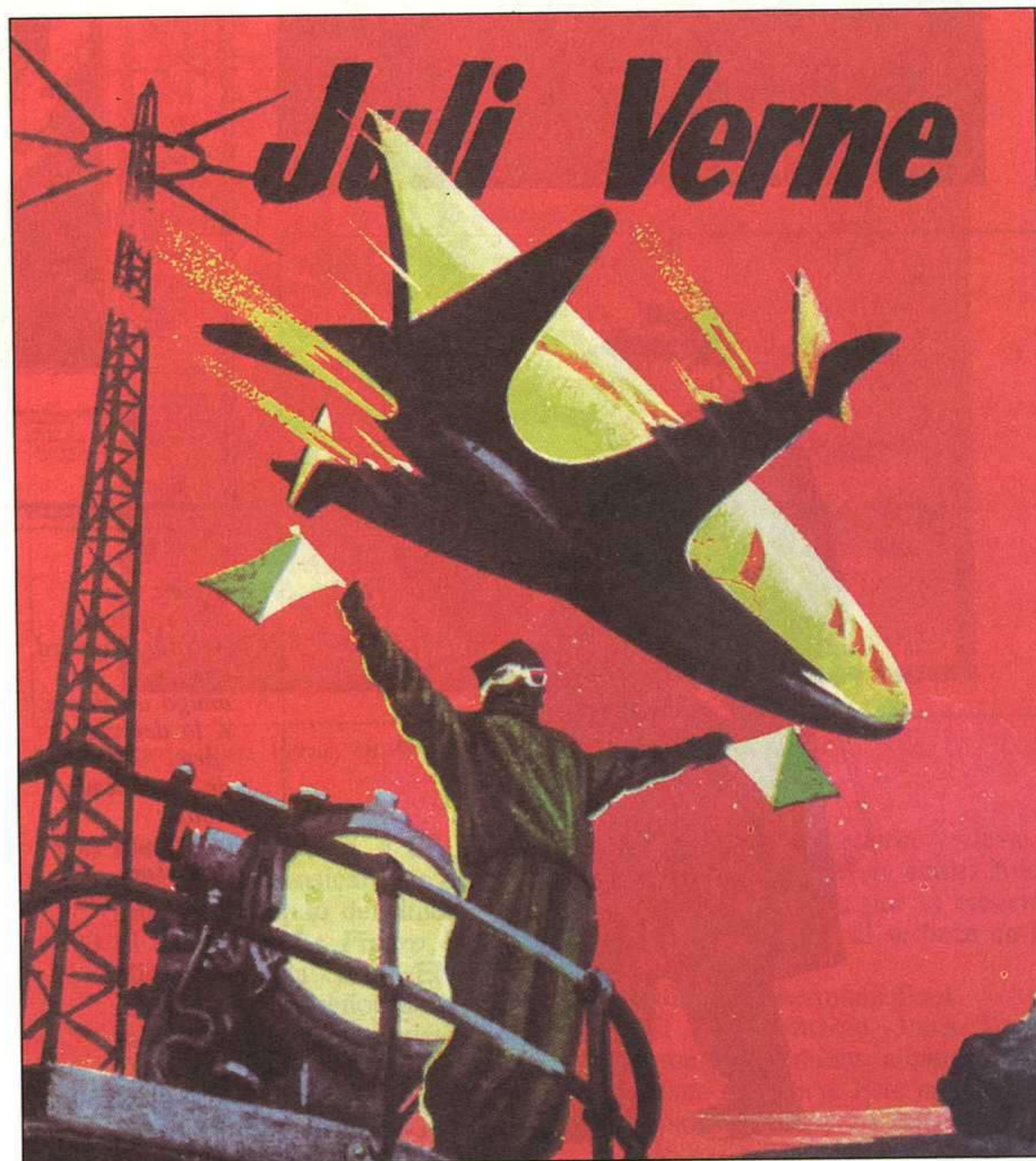
J. MONTSERRAT, DE LA TERRA A LA LLUNA, BARCELONA: M. ARIMANY, 1961.