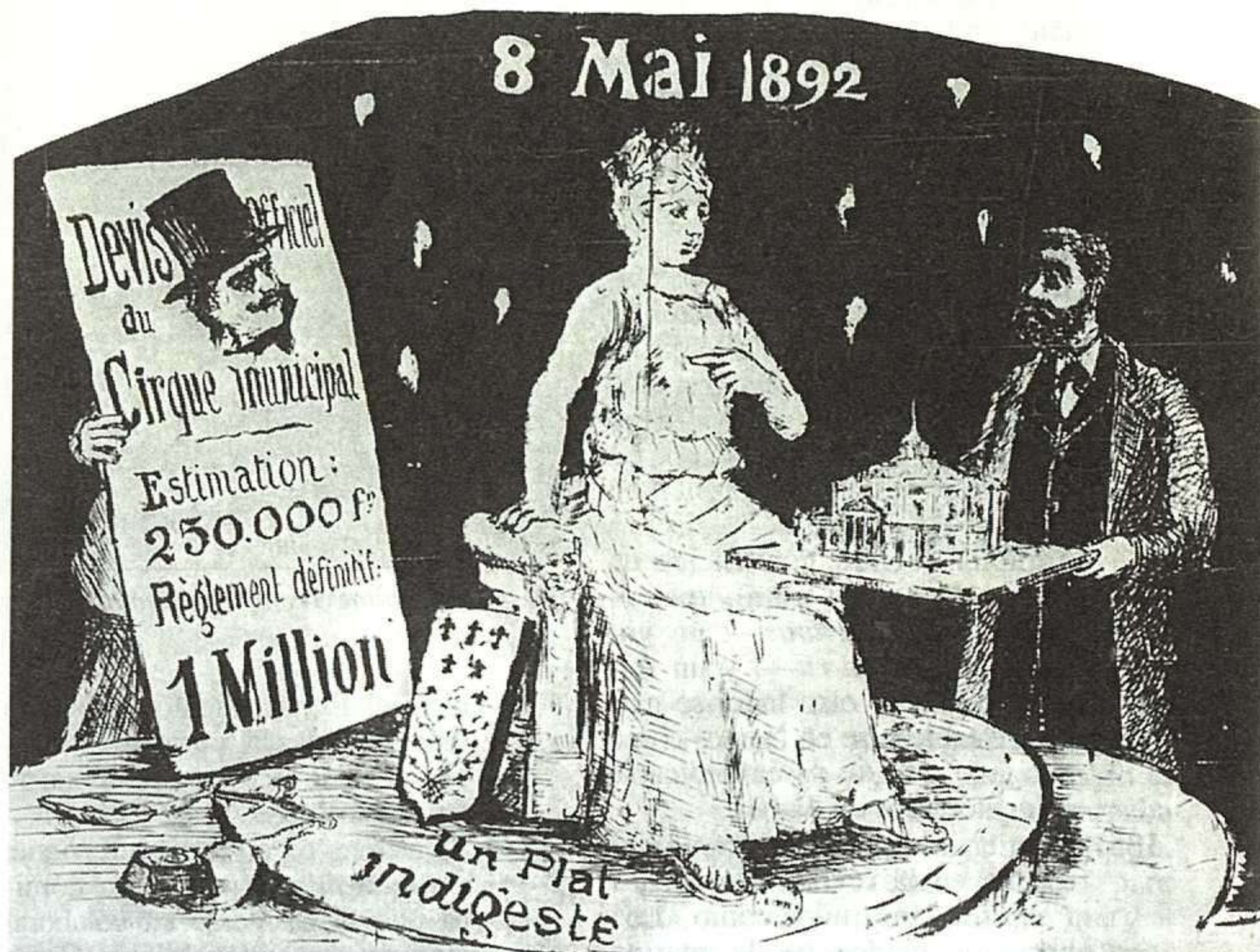
Caricatura de las elecciones de 1892, en las que Verne fue reelegido concejal de Amiens.