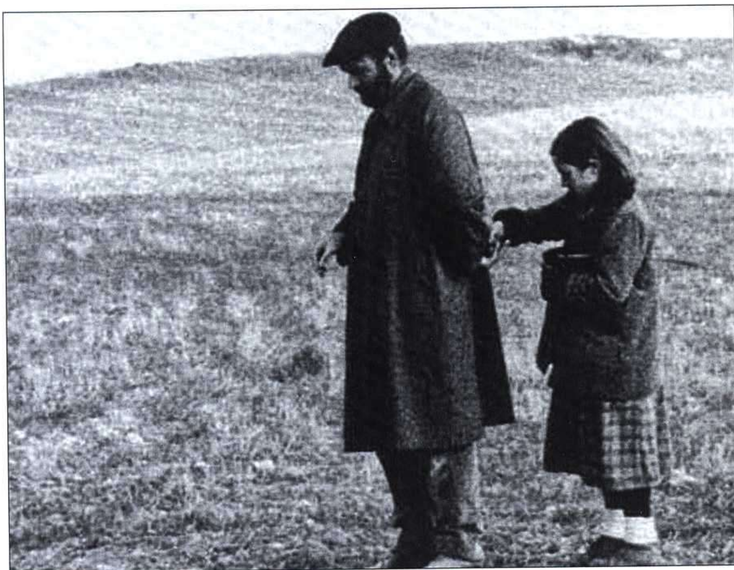
Dentro del cine, poco, que ha hecho Víctor Erice, hay otro cine: el que el director evoca, sueña o inventa. El que ven sus personajes, como Ana (imagen superior), que ve por primera vez Frankenstein. También en El Sur hay un cine, Arcadia.