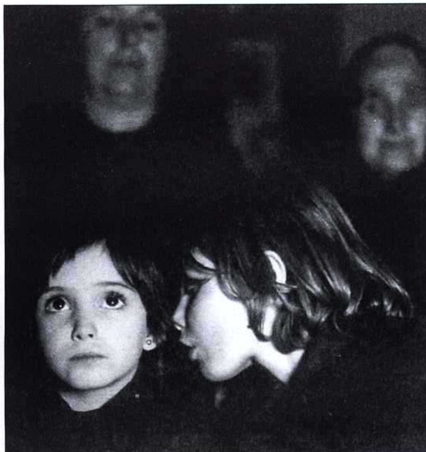
En sus películas, Erice nos ofrece niñas que miran, inspiradas en aquel niño —él— que miraba la vida. Y el cine. La escena más significativa de El espíritu... es aquella que muestra la mirada de Ana cuando ve, realmente por primera vez, al monstruo.

paso al actual palacio de proyecciones, festivales y eventos, de muy discutible funcionalidad y estética. Una doble reflexión sobre el tiempo, sus efectos y sus estragos.