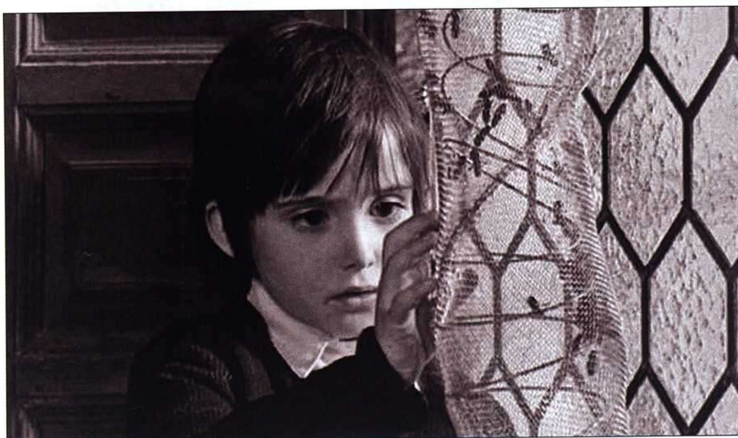
Arriba, fotograma de The Scarlet Claw (1944), de Roy William Neil, protagonizada por Basil Rathbone ( Sherlock Holmes ). Abajo, El espíritu de la colmena .

El corto citado relata, sólo con planos de fotos fijas, material de archivo en su mayoría, dos temas que se complementan: la experiencia del niño viendo en un cine señorial de su ciudad la película que poblaría luego sus pesadillas, y la desaparición del edificio espléndido, majestuoso, insustituible que era el casino y cine, destruido para dar