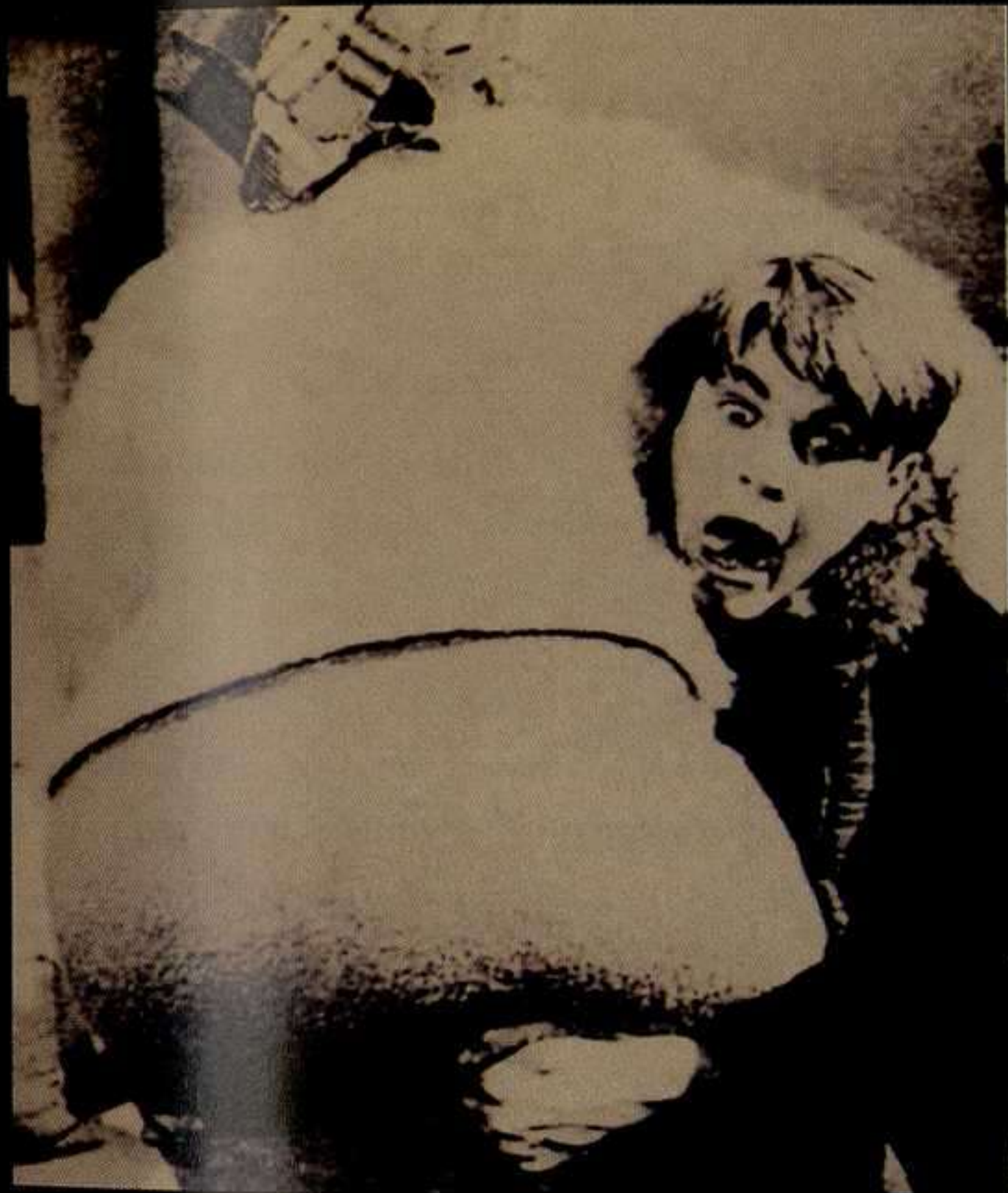
Escena de Roma , 1972

Me reprochan no contar siempre de la misma manera la misma historia. Pero esto sucede porque me invento desde el principio toda la historia, y encuentro que repetirme es aburrido para mí y poco amable para los demás.