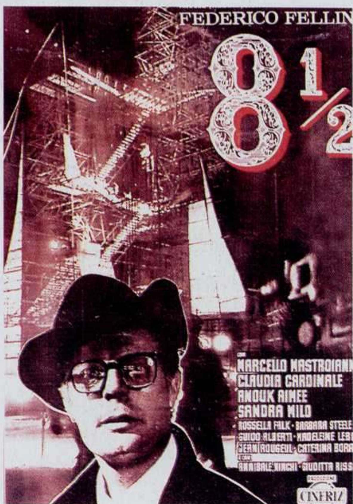
Cartel de Fellini, Ocho y medio , 1963