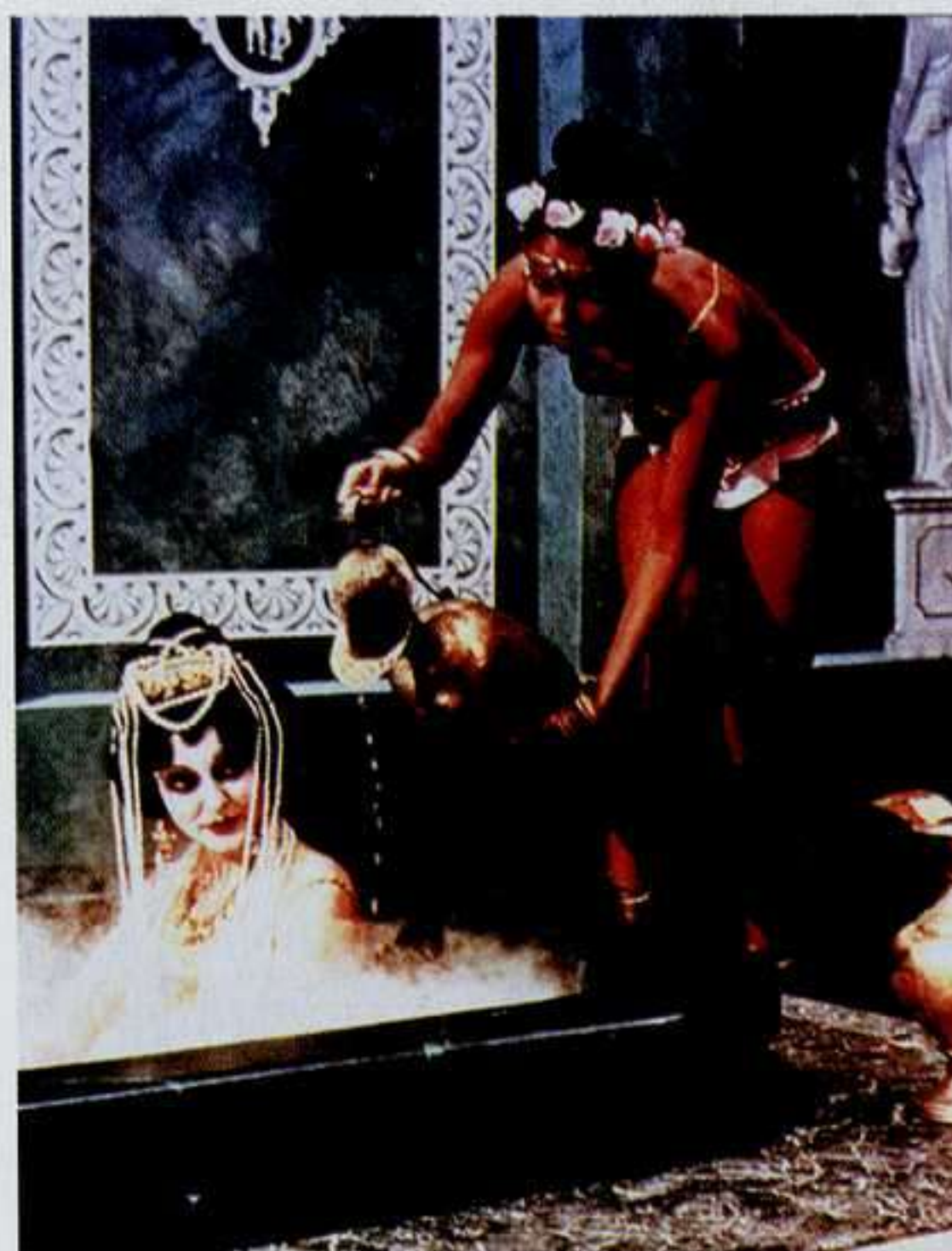
Escena de Satiricón , 1969

Nada es más triste que la risa; nada más hermoso, magnífico, estimulante, y enriquecedor que el terror de la desesperación profunda. Creo que cada hombre, mientras vive, es prisionero de este miedo terrible, en el cual toda prosperidad está condenada a fracasar, pero que guarda, incluso en su abismo más profundo, esa libertad esperanzadora que le permite sonreír en situaciones aparentemente desesperadas. Por eso la intención de los auténticos escritores de comedia —es decir, los más profundos y honestos— no es de ningún modo divertirnos únicamente, sino abrir desgarradoramente nuestras cicatrices más dolorosas para que las sintamos con más fuerza. Esto se puede aplicar a Shakespeare y a Molière tanto como a Terencio y a Aristófanes. Por otro lado, no existe un verdadero poeta trágico —estoy pensando en Eurípides, Goethe, Dante— que no sepa cómo mantener sus sufrimientos más terribles a una cierta distancia irónica.