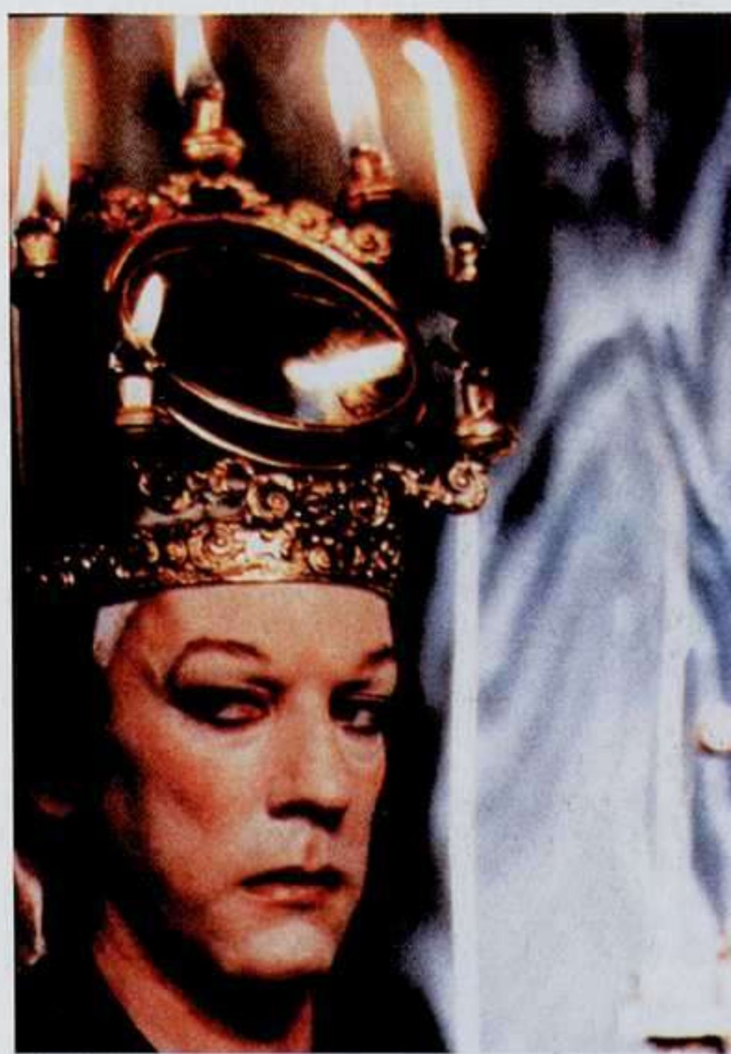
Escena de Il Casanova , 1976