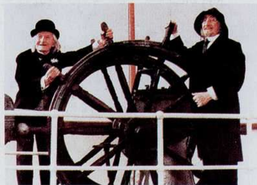
Escena de Y la nave va , 1983