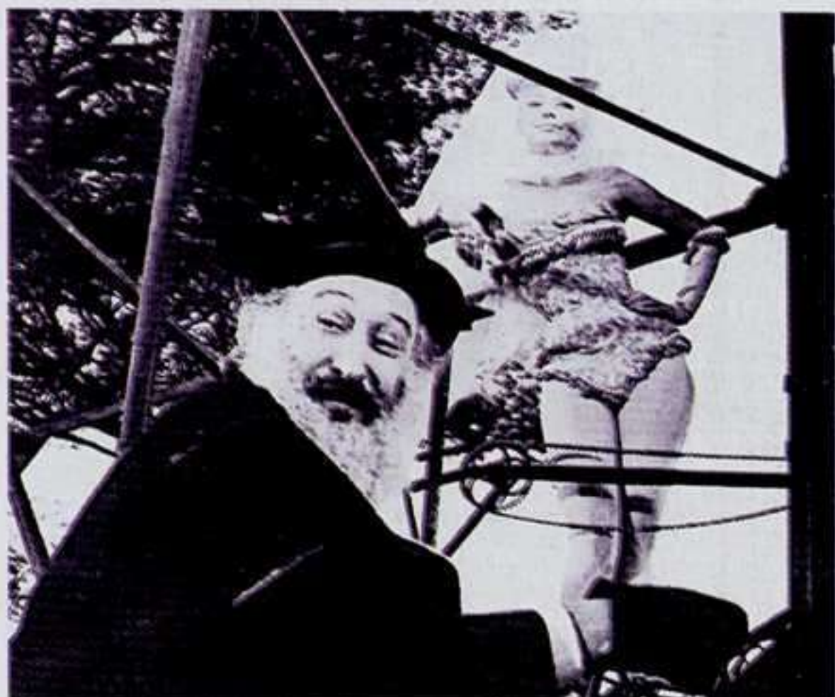
Escena de Julietta de los espíritus , 1965

Nunca hago juicios morales, no estoy capacitado para ello; no soy censor, ni cura, ni político. No me gusta analizarme; no soy orador, ni filósofo, ni teórico. Sólo soy un narrador y el cine mi oficio.