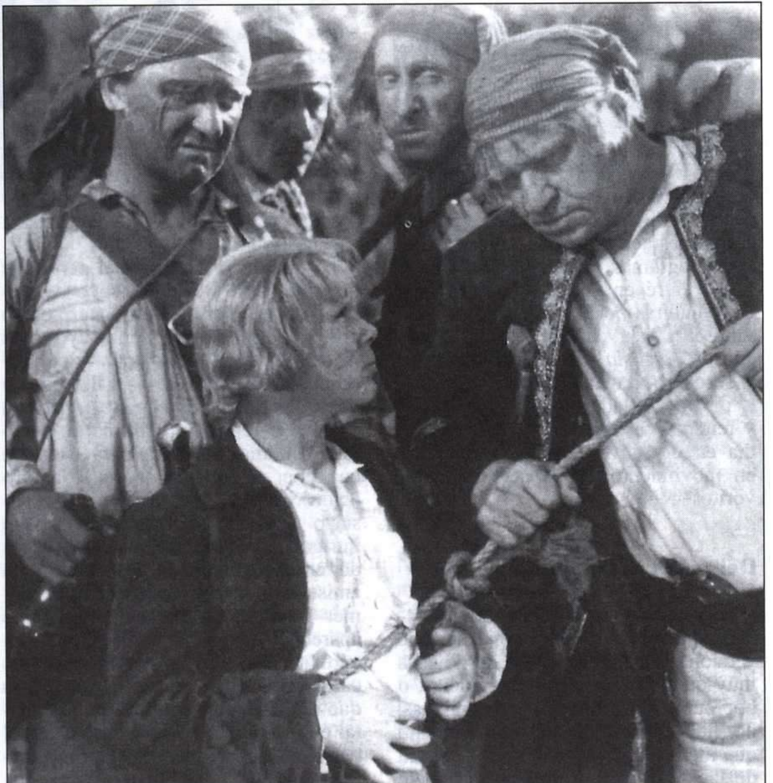
Wallace Beery hizo una composición memorable del pirata John Silver.

Después de leer en diversas ocasiones el clásico de Raymond Chandler The big sleep en catalán, castellano y en francés —no doy para más— y de ver repetidamente la película doblada y en versión original con subtítulos, me asombrada que algún aspecto del argumento se resistiera a mi comprensión y permaneciera en la penumbra. Más tarde supe que durante el rodaje del filme, con guión, nada menos que de William Faulkner, el director, el gran Howard Hawks, preguntó a éste y al autor quién mataba a quién en un momento de la acción, que es lo mismo que yo me he preguntado en más de una ocasión ¡Más fidelidad al original, imposible!