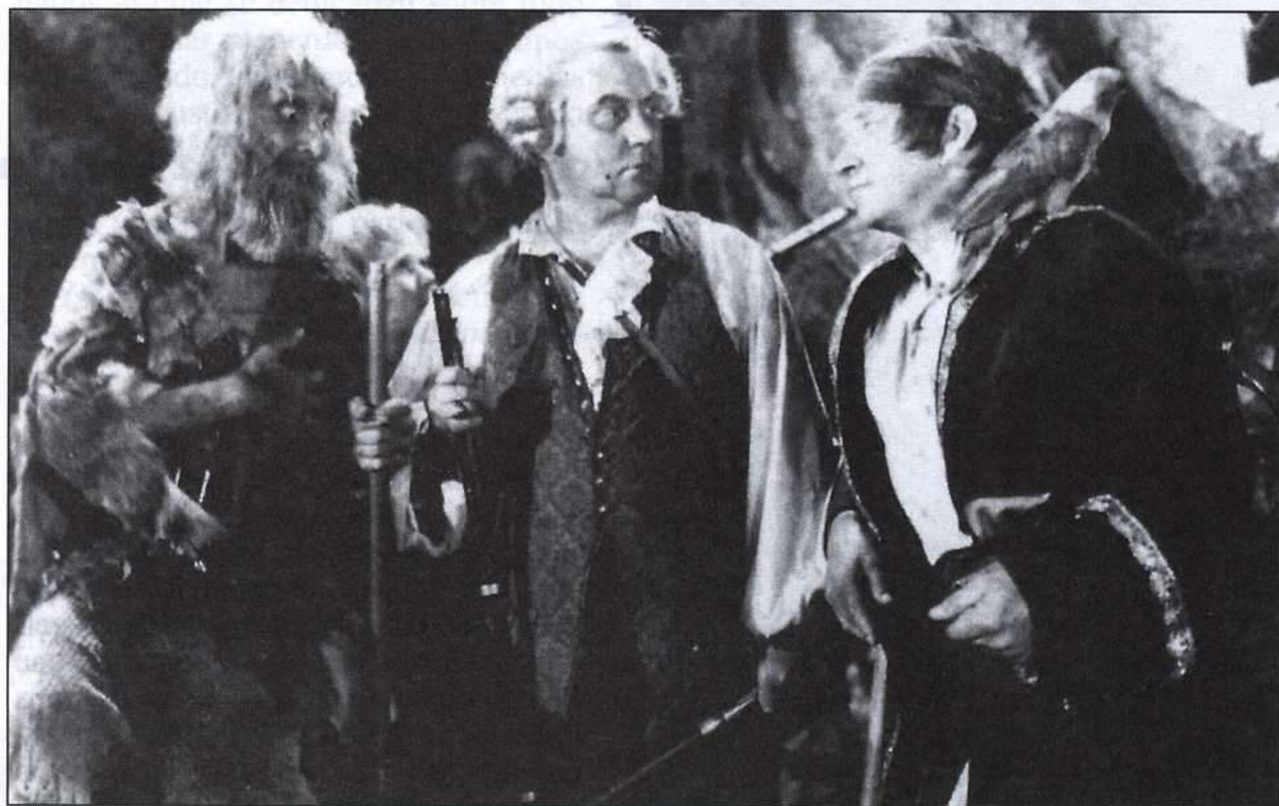
LA ISLA DEL TESORO.

¿Qué se hizo del Capitán Flint, el loro que cantaba sin cesar aquello de «Partieron sesenta y cinco y sólo volvió uno vivo», convertido en protagonista de una narración que todavía no he publicado?