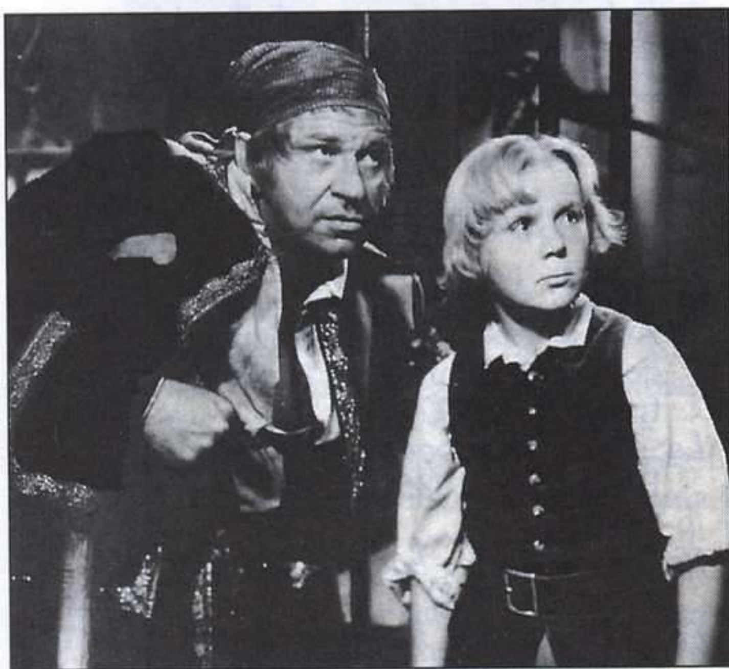
LA ISLA DEL TESORO. VICTOR FLEMING (1934).

Dir. Victor Fleming. Prod. MGM (EE.UU.). Intér. Wallace Beery, Jackie Cooper, Lionel Barrymore. Disponibile en vídeo.