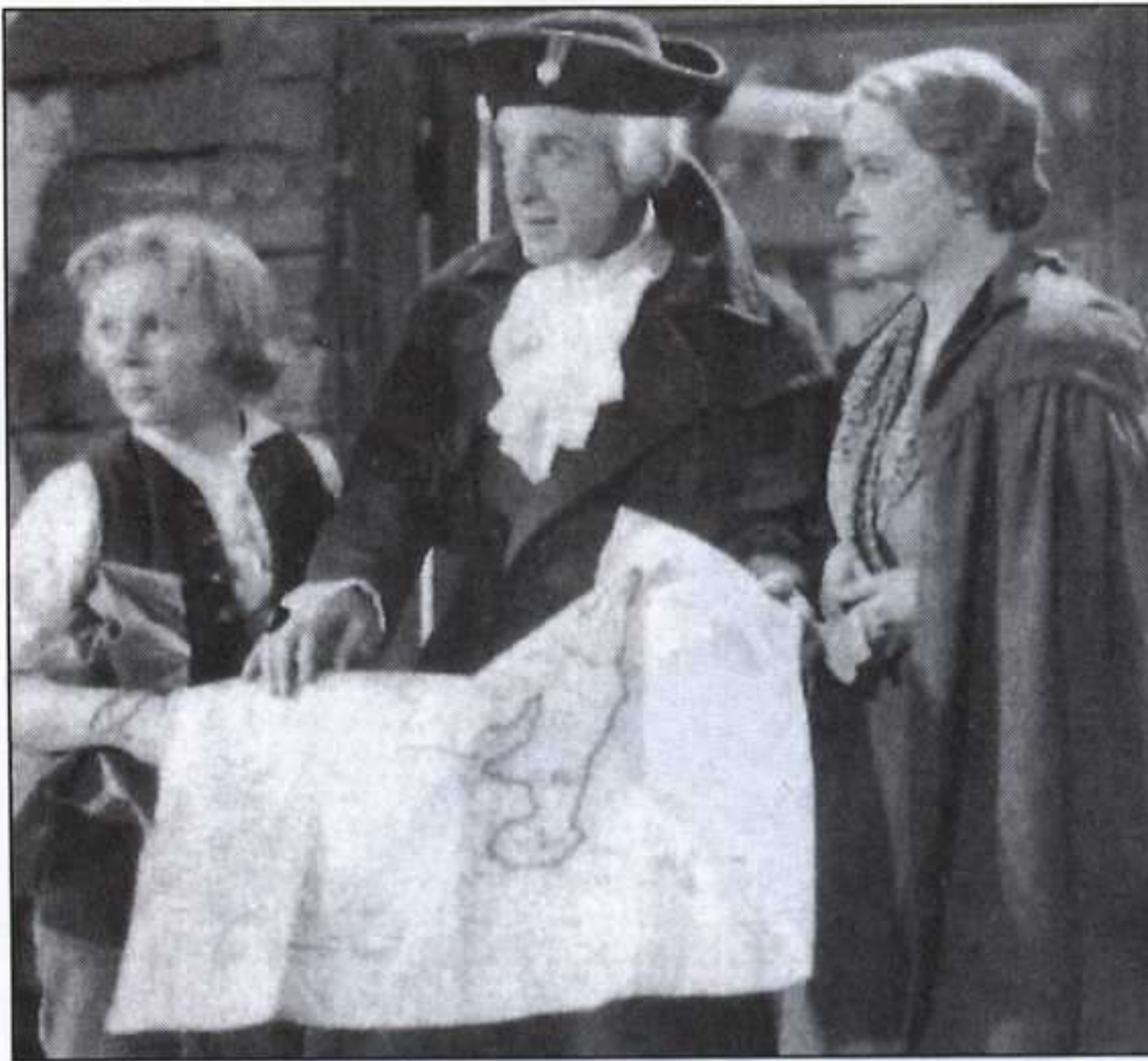
LA ISLA DEL TESORO.