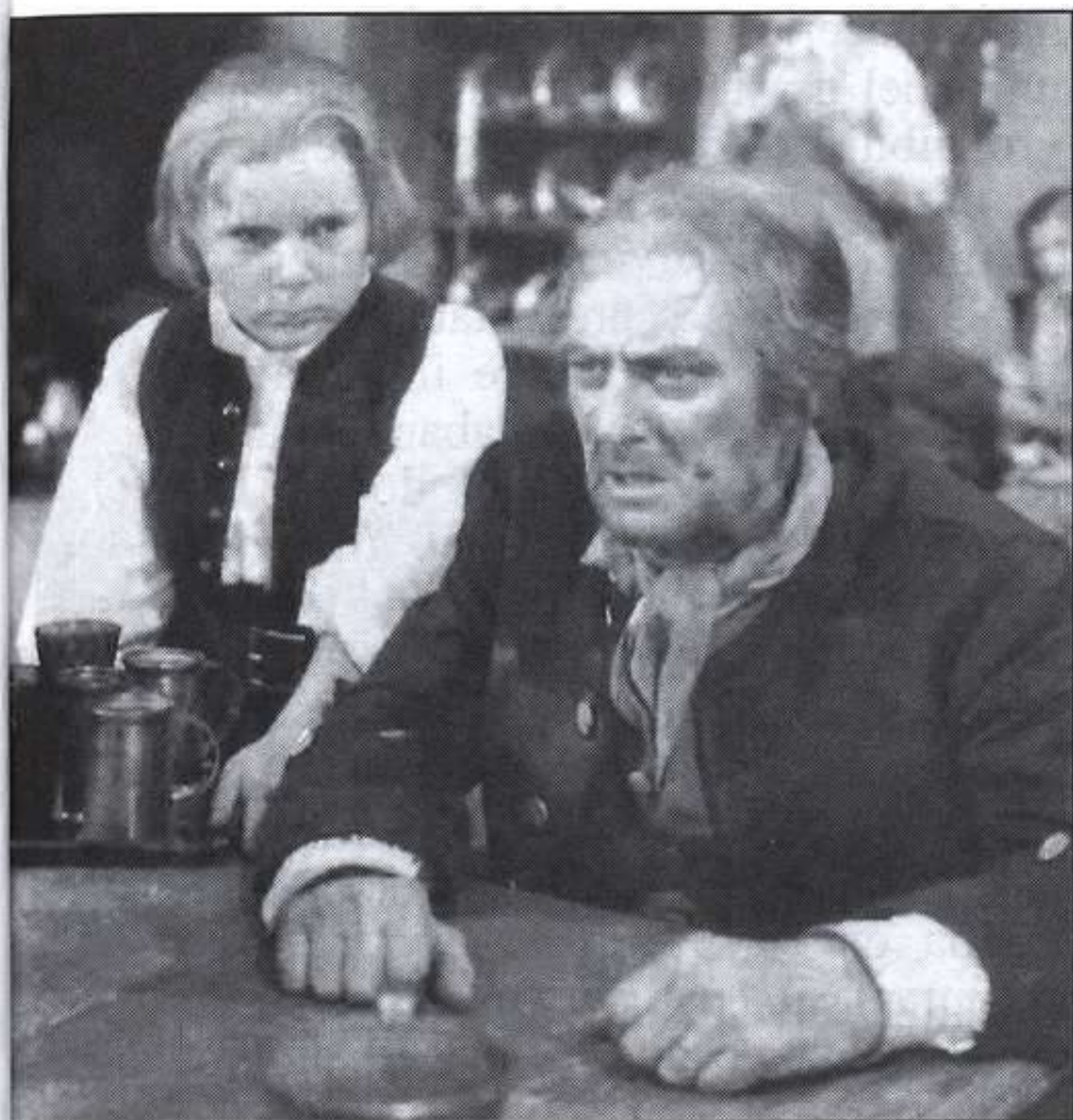
Lionel Barrymore es uno de los atractivos de esta versión de 1934.