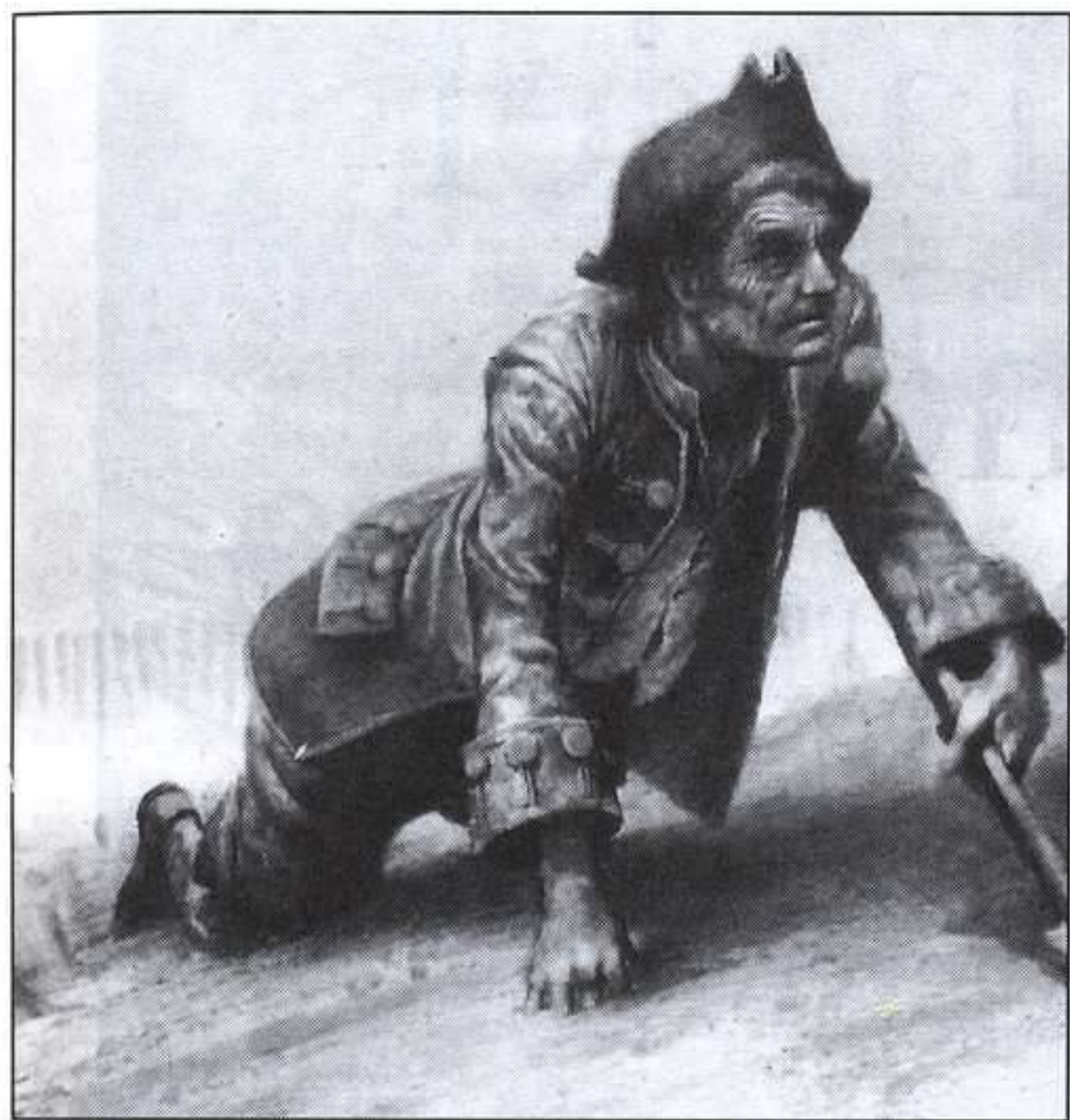
R. INGPEN. LA ISLA DEL TESORO, BARCELONA: VICENS VIVES, 1992.