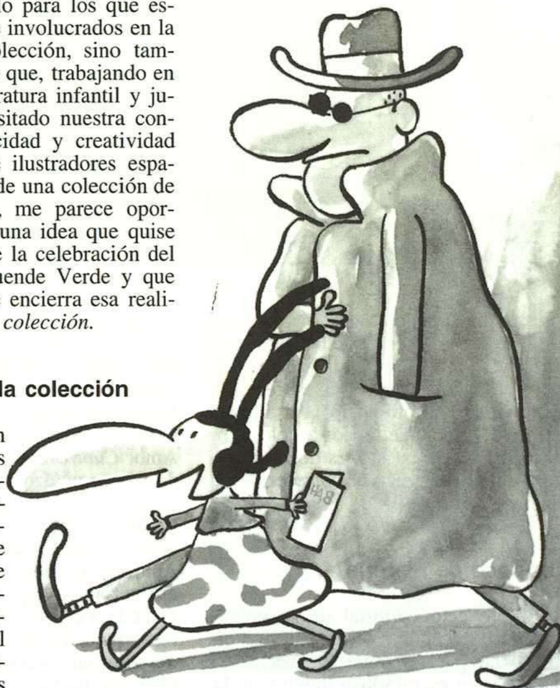
JAVIER VÁZQUEZ, NO SE LO CUENTES A NADIE, MADRID: ANAYA, 1994.