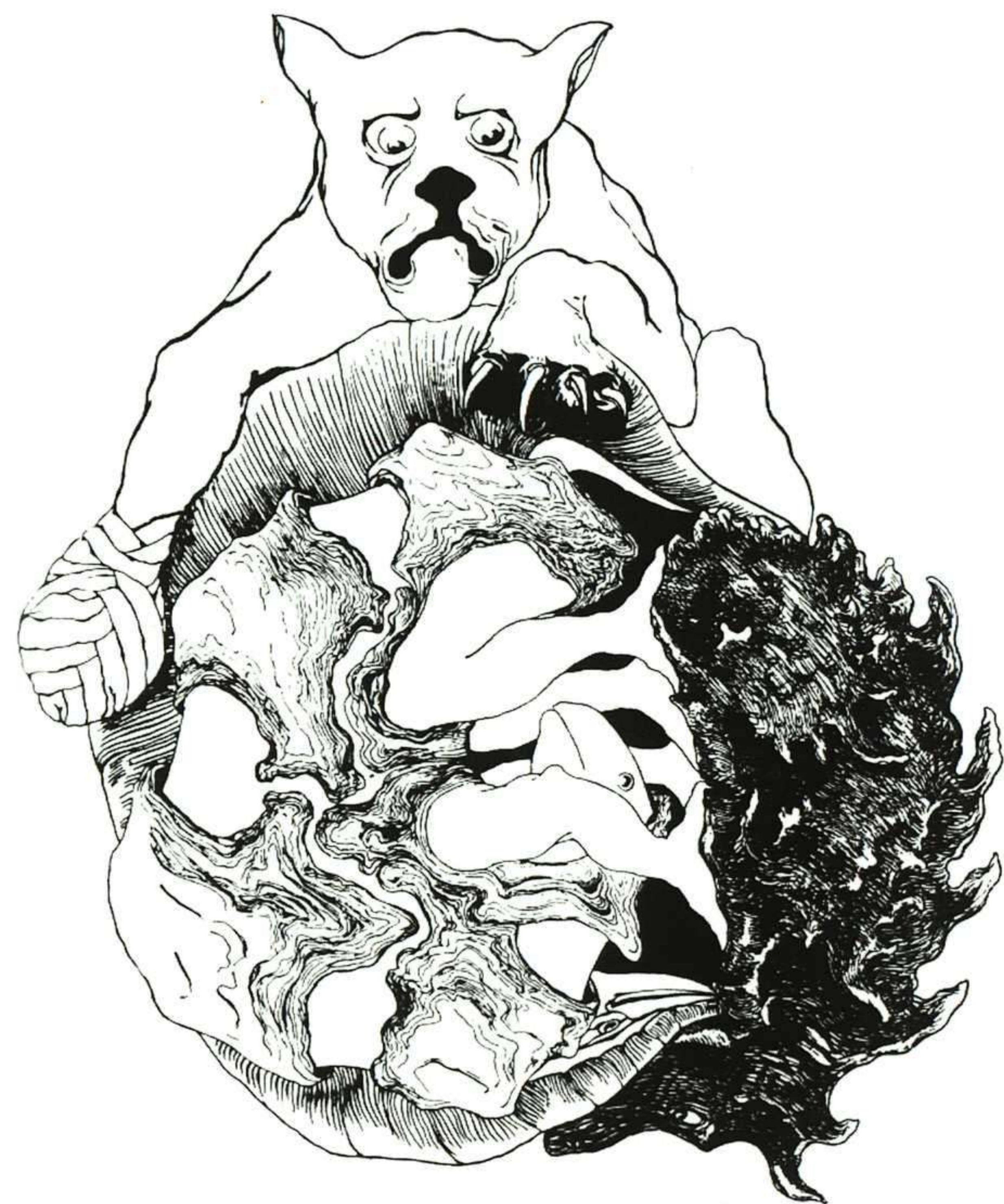
RUDYARD KIPLING, SÓLO CUENTOS, ANAYA, 1988.

la Real Academia Española, que para algo trabajan los señores académicos, y veamos qué nos dice: Imaginación : «Facultad del alma que representa las imágenes de las cosas reales o ideales». Esa representación de las cosas reales y, sobre todo, de las ideales, es decir, de las que nosotros mismos fabricamos para nuestro mundo interior y que es la puerta que abre al hombre la existencia de ese universo espiritual que designamos con la breve palabra de arte . Sin imaginación no puede haber creadores artistas, ni tampoco espectadores capaces de captar y valorar la expresión artística.