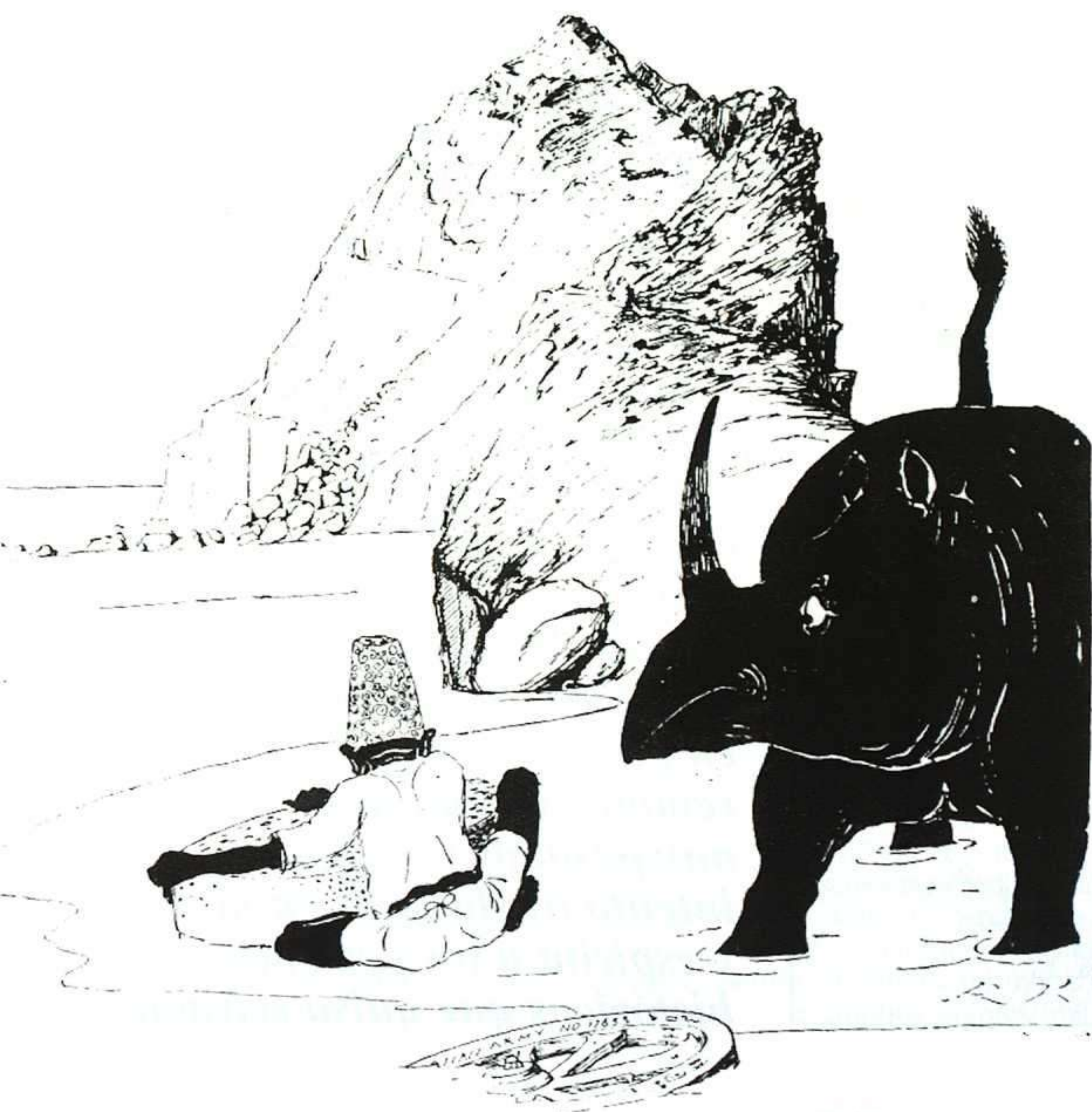
RUDYARD KIPLING, SÓLO CUENTOS, ANAYA, 1988.

Este artículo se publicó como Apéndice en la edición de Sólo cuentos (para niños) , de Anaya (1988).