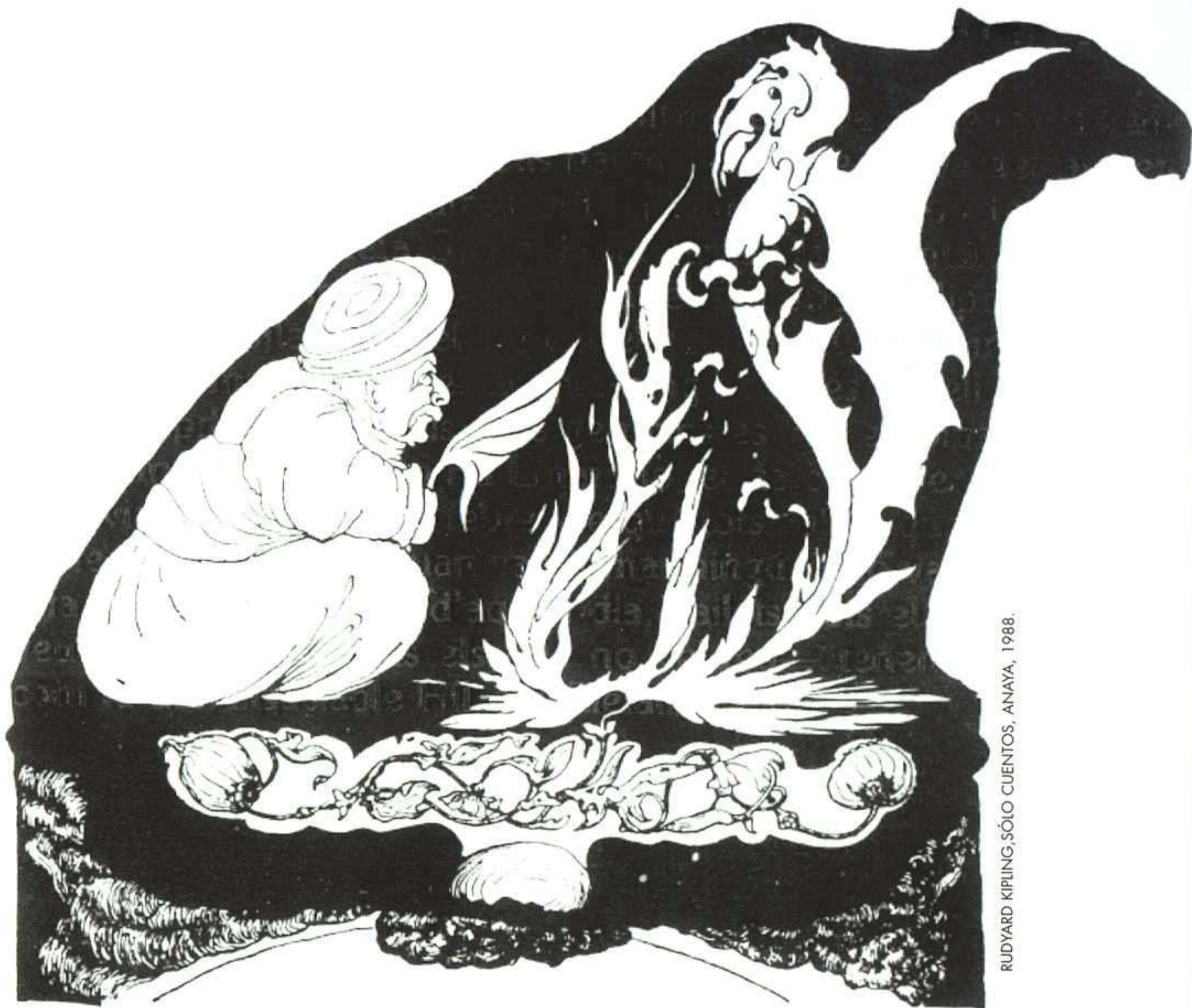
RUDYARD KIPLING, SÓLO CUENTOS, ANAYA, 1988.

En Sólo cuentos volvemos a encontrarnos con buena parte de esos seres peculiares, con esos extraordinarios animales que razonan y hablan con la mayor lógica, que se expresan con más claridad que ningún hombre y que interpretan aventuras de un colorido y de una fuerza impensada, llevados de la mano por el prodigioso ingenio de su creador. La galería de animales espiritualizados que Kipling presenta en este libro es, según los casos, paradigma del talento o de la estupidez del ser humano, quizá porque a Kipling le resultaba más fácil criticar la tontería, la mala educación, la