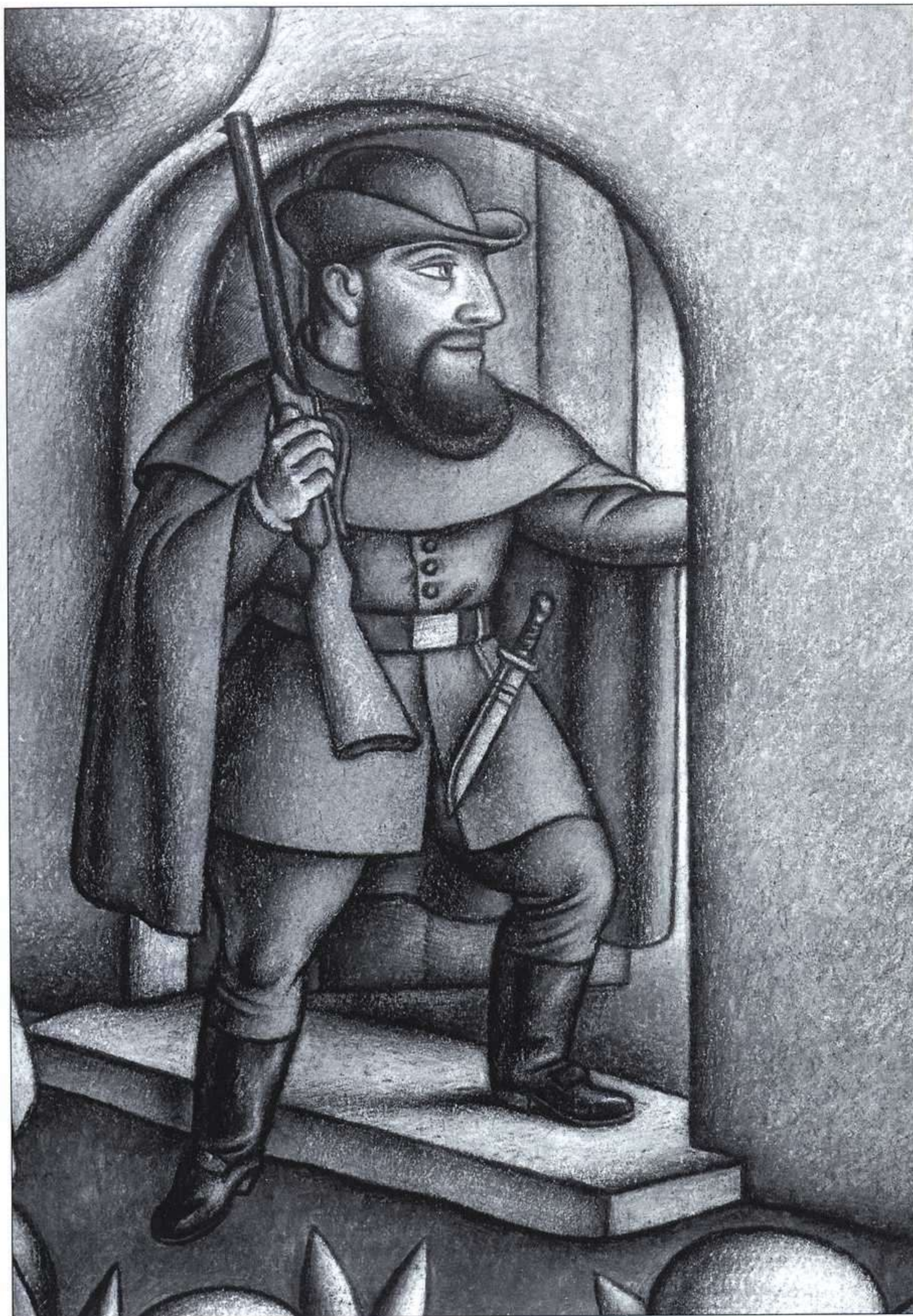
JAVIER SERRANO, CAPERUCITA ROJA, CÍRCULO DE LECTORES/AURA, 2002.

El lobo, jugando a la perfección el papel del seductor hambriento que no desdenna ningún bocado, piensa en el modo de doblar su festín: «Esta joven y tierna presa es un dulce bocado y sabrá mucho mejor que la vieja; tengo que hacerlo bien desde el principio para cazar a las dos». La avidez por el más tierno bocado, no anula el deseo por la anciana. En las novelas donde el hombre «se pierde» por los encantos de las adolescentes, el