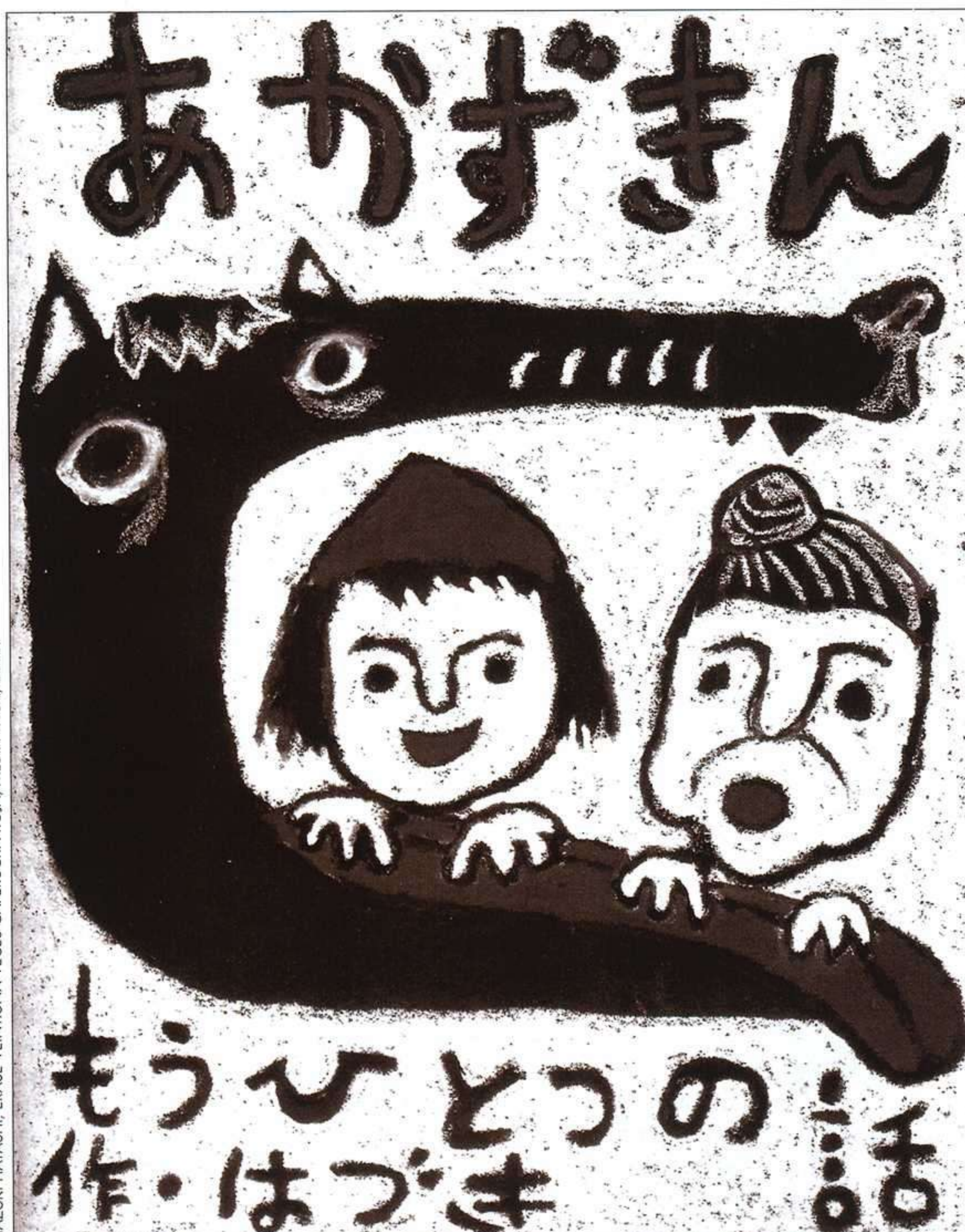
HAZUKI HAYASHI, ERASE VEINTIUNA VECES CAPERUCITA ROJA, MEDIA VACA, 2006.

Caperucita Roja es, con diferencia, el relato que mejor define la búsqueda de la identidad sexual y refleja los peligros que tal descubrimiento acarrea. La caperuza roja es el símbolo sexual de la pubertad; y el rojo, color de la sangre menstrual, es también el color de la pasión y el deseo.