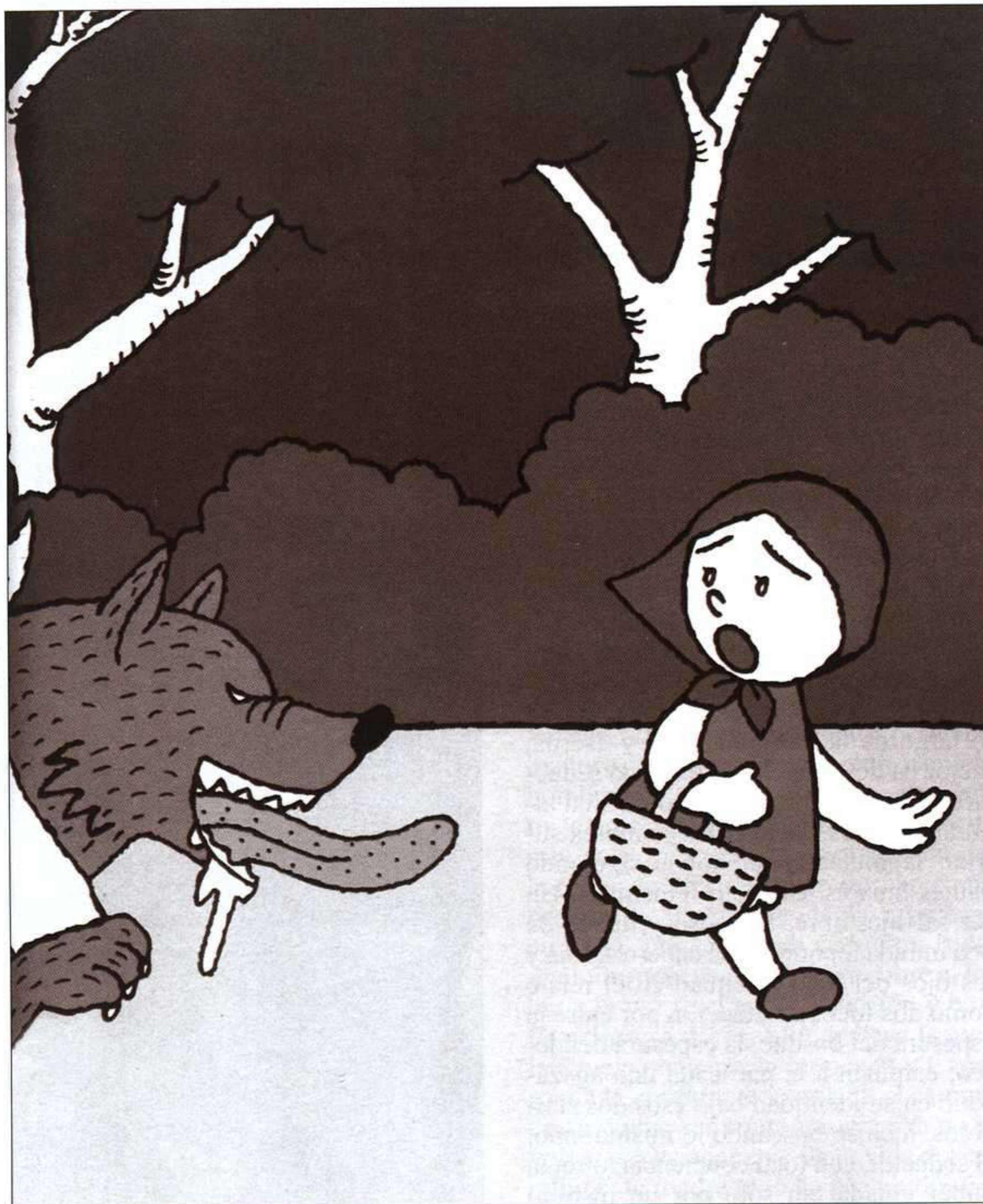
AYABO, ERASE VEINTIUNA VECES CAPERUCITA ROJA, MEDIA VACA, 2006.

Al principio del cuento recogido por los hermanos Grimm se nos presenta la imagen de «una pequeña y dulce muchachita que en cuanto se la veía se la amaba». Una definición de las niñas en el justo momento en que apunta la mujer que ya promete; y ese «verla y amarla», responde a un canon de deseo muy extendido en la literatura universal en su versión de «lolas» capaces de enloquecer a los hombres maduros. Es su abuela quien primero reconoce los cambios en su nieta —el papel de mujer en el término de su vida sexual