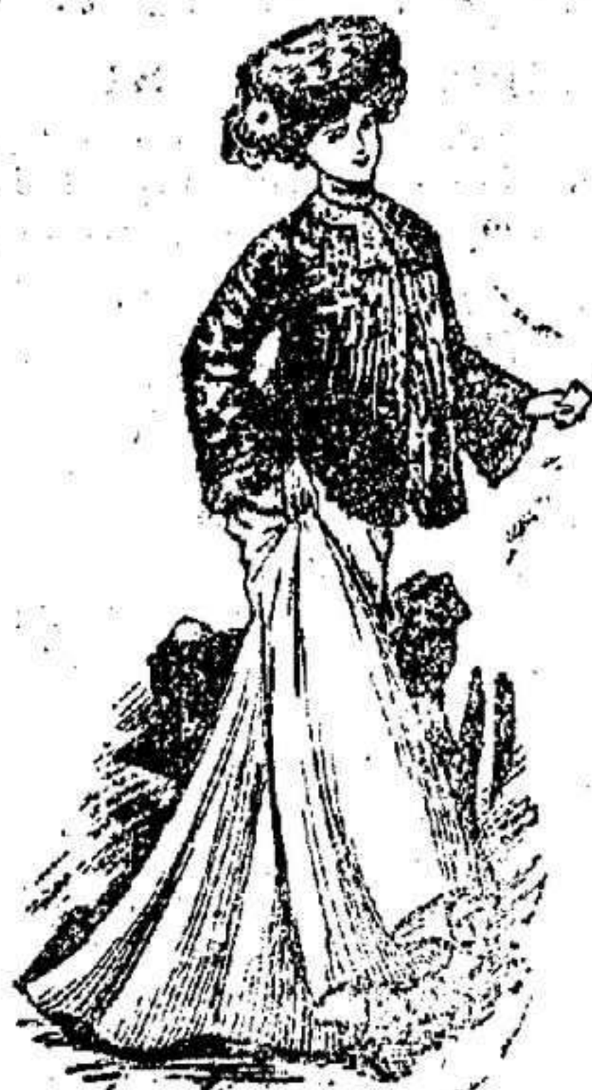
Traje para visita

Lo constituye un bonito abrigo de astrakán