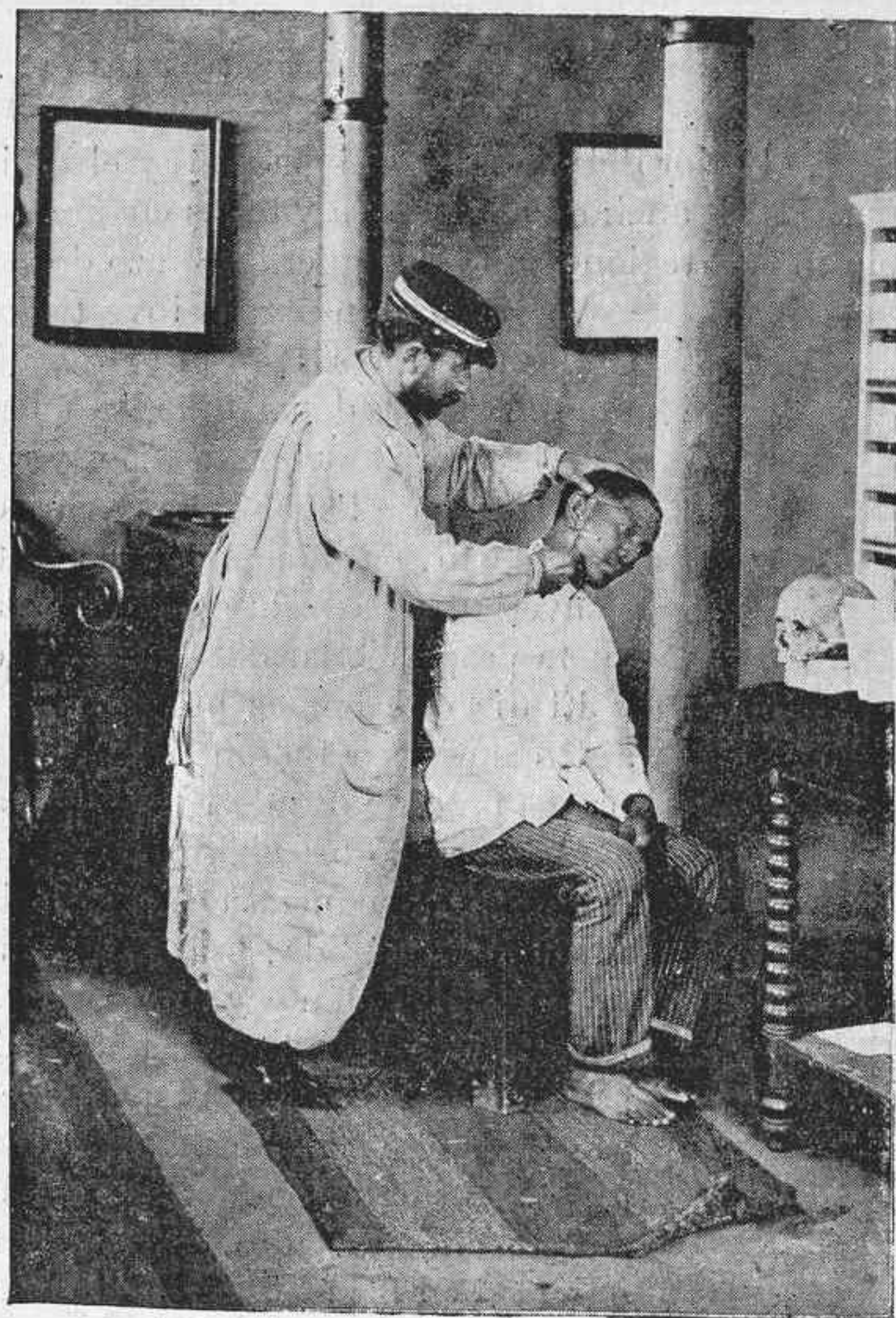
MEDIDA DE LA OREJA.