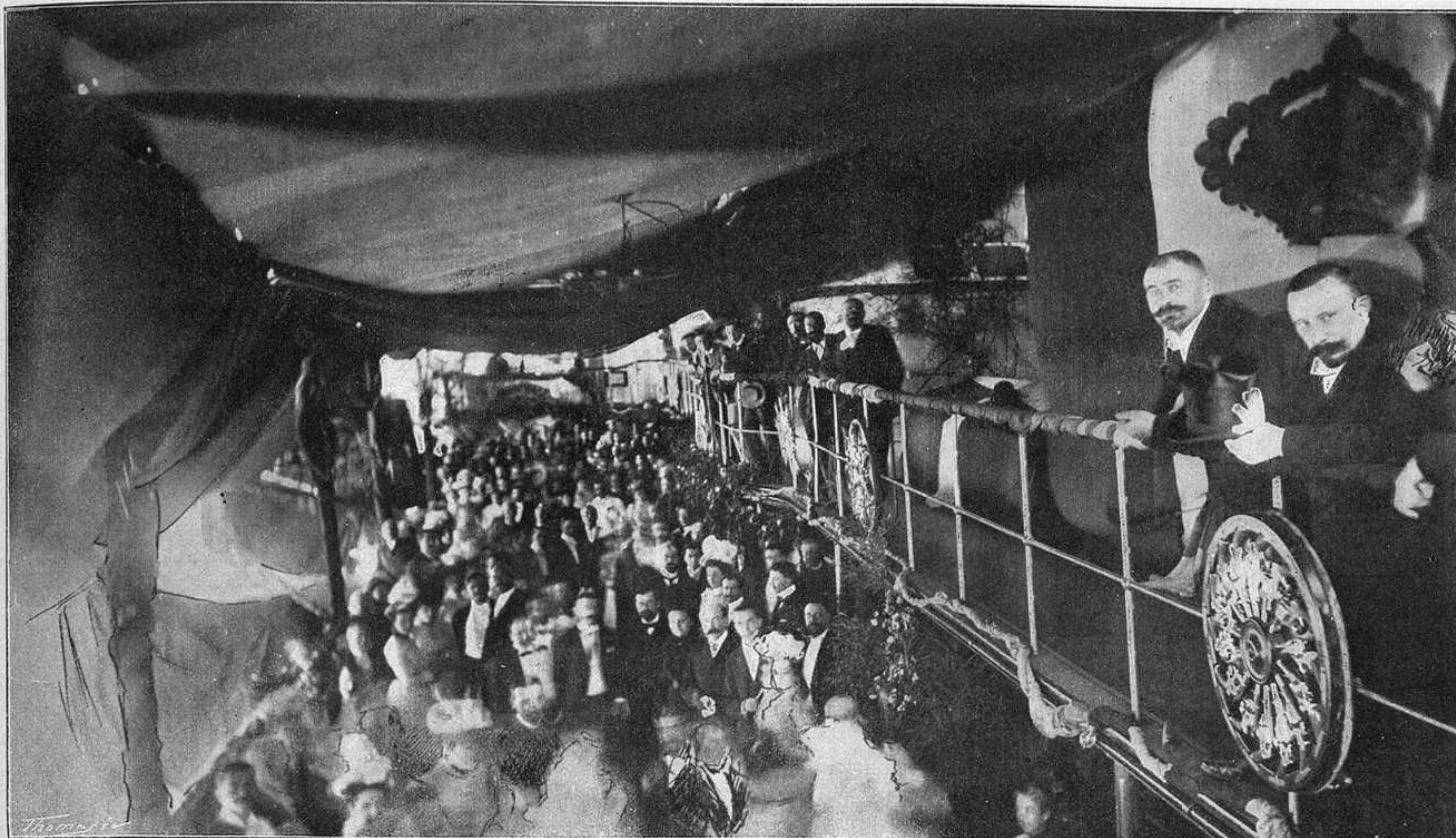
FIESTA CELEBRADA Á BORDO DEL ACORAZADO «BRENNUS»

El almirante Fournier, uno de los marinos más ilustres de Francia y de los que de mayor reputación gozan en el Estado Mayor general de la Armada y en el pueblo francés, nació en Tolón en 23 de mayo de 1842, ingresó en la Armada en 1859, fué guardia marina en 1861 y alférez de navío en 1865. Ascendido cuatro años después á teniente de navío, prestó grandes servicios á su patria durante la guerra franco-prusiana. En 1.º de octubre de 1879 fué promovido á capitán de fragata, ascendiendo al empleo superior inmediato en 24 de mayo de 1884, á contraalmirante en 1891 y á almirante en 1897. Es comendador de la Legión de Honor, oficial de Instrucción Pública y posee gran número de condecoraciones extranjeras. Tiene arrogante figura y el rostro curtido por el aire del mar y por el sol; está dotado de instrucción vastísima, y su trato, de perfecto y cumplido caballero, cautiva á cuantos tienen la honra de conocerle.