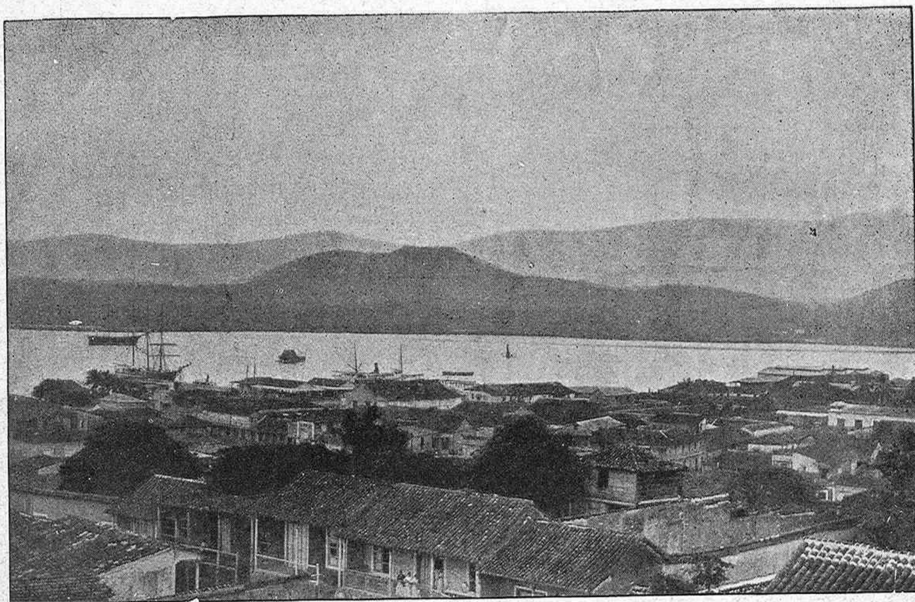
VISTA DE SANTIAGO DE CUBA Y LA BAHÍA

Por ahora, es decir, cuando escribimos estas líneas, Santiago de Cuba es el objetivo principal de los yankées el punto por el cual tratan de vulnerar la posesión de España en la gran Antilla. Y en la esperanza tímida de poner en práctica las fanfarronadas de Sampson y Schley de destruir nuestra escuadra, á Santiago de Cuba dirigen todos ó casi todos sus ataques. En ninguno de ellos han logrado ventaja alguna; en todos han sufrido daños, si no tan considerables como hubiéramos de desear, á lo menos los bastantes para enseñarles que España es un país que sab luchar, aun cuando su enemigo sea mucho más poderoso.