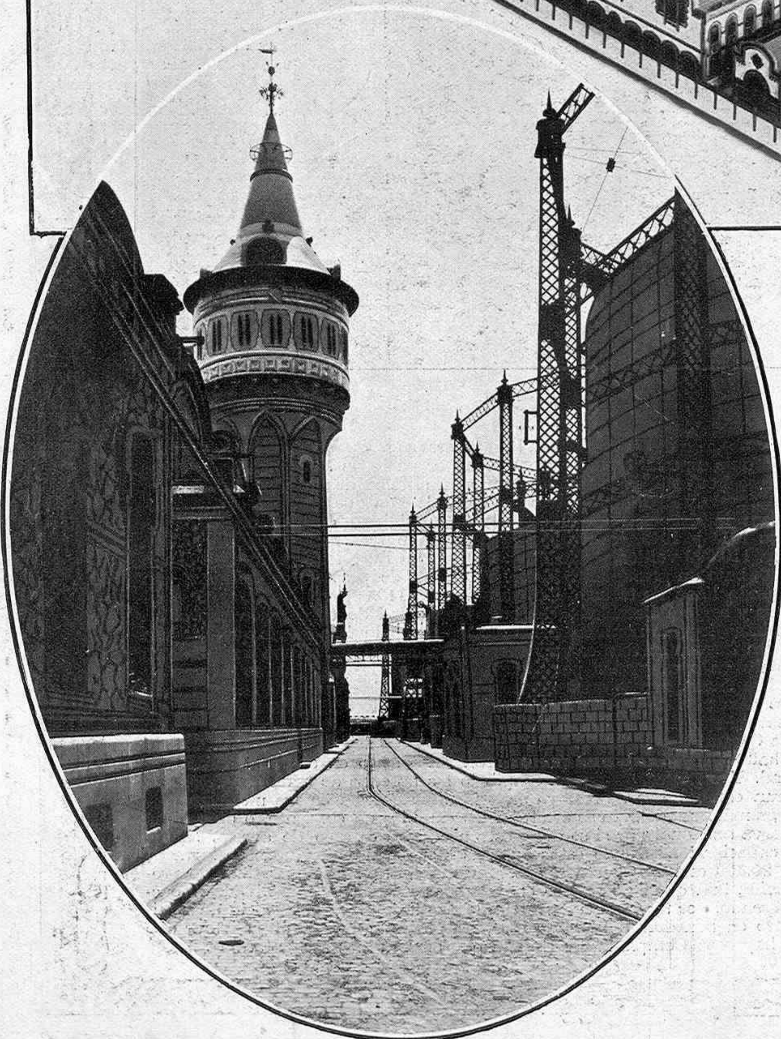
Gasómetros de la Fábrica del Gas de la Barceloneta

ESTA Compañía explota las industrias de alumbrado, calefacción y fuerza motriz por medio del gas, la electricidad ú otros medios en varias regiones y poblaciones de España. Su objeto social comprende, además de las industrias anteriores, cuantas otras empresas se deriven ó estén más ó menos relacionadas con ella.