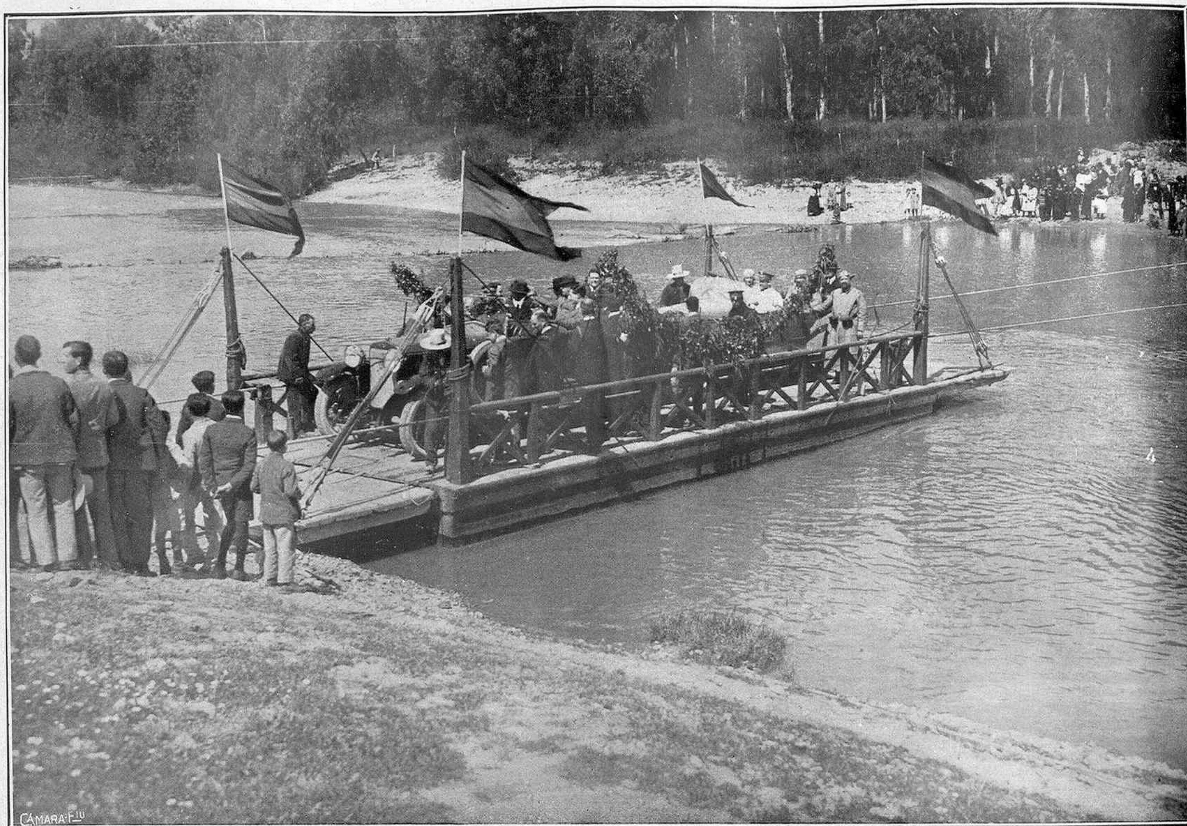
Su Majestad el Rey pasando en la balsa sobre el río Guadalquivir

La estancia de los Monarcas españoles en Andalucía ha puesto de relieve una vez más las fervorosas simpatías que Don Alfonso y Doña Victoria cuentan entre nuestro pueblo. En cuantas localidades estuvieron ambas augustas personas pudieron apreciar cuán adentrados están