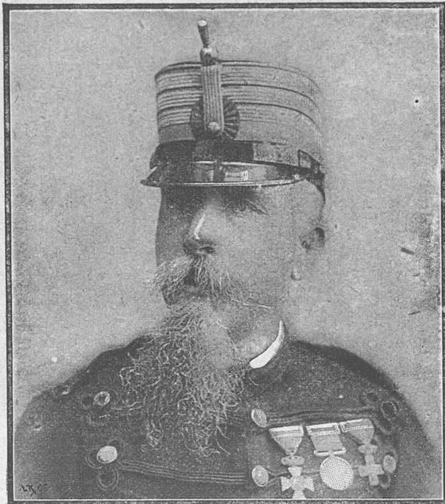
El General D. Joaquín Vara de Rey y Rubio, MUERTO GLORIOSAMENTE EN EL CANEY.

Miércoles 13. —El pánico de Barcelona se ha extendido rápidamente por todas las costas... y las que no son costas. En Málaga el comercio francés ha acordado también colocarse bajo el protectorado de su nación, y los españoles seguirán inmediatamente el ejemplo. En algunos otros puertos dicen que no les envíen la escuadra de Cámara por lo que más quieran, porque les molesta-