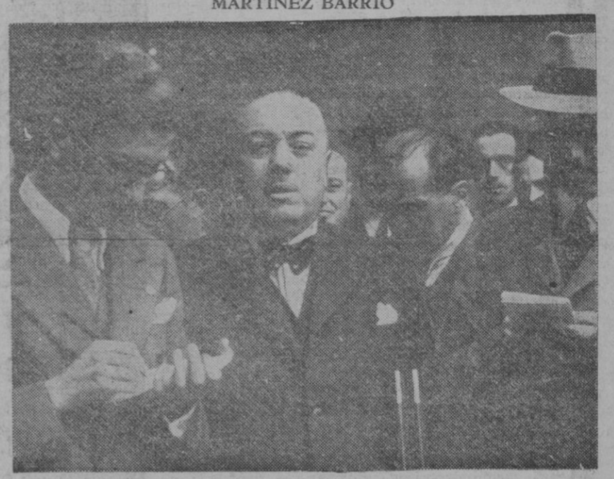
Con motivo de haber sido elegido jefe del Estado don Manuel Azaña, el señor Martínez Barrio cesó ayer en tales funciones, que desempeñaba interinamente desde la destitución del señor Alcalá Zamora

Este número ha sido visado por la censura