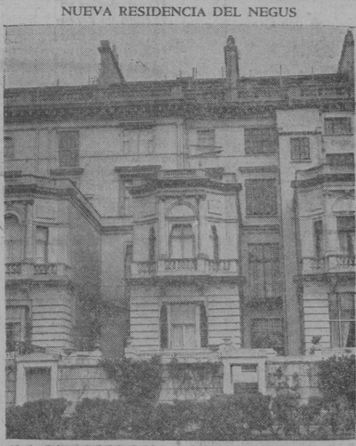
Haile Selassie, presintiendo sin duda el fin de su reinado, ha adquirido en Londres un palacio en el que se propone residir. La fotografía muestra la fachada del gran edificio

Especialista en enfermedades de corazón y pulmón Rayos X. Diatermia. Electroterapia. Luz ultravioleta, etcétera Consulta de once a una y de cuatro a seis Teléfono 178