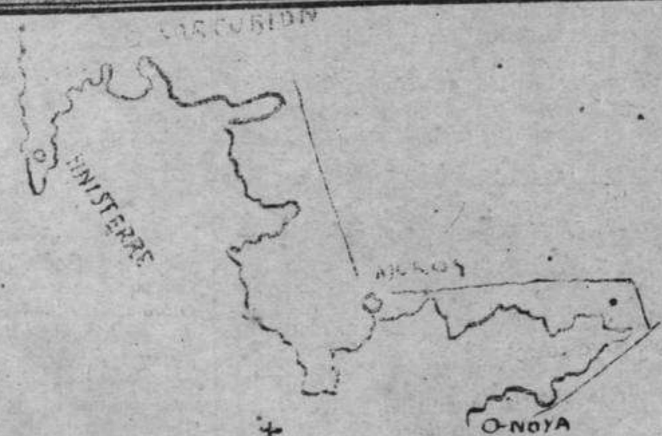
Croquis de un trozo de la costa llamada «de la muerte» donde ocurrió el suceso

El croquis de la costa de «la muerte» y el apunte que reproducimos tomado á las nueve de la mañana del 28 de Octubre, diez segundos antes de sumergirse el Cardenal Cisneros , podrán dar una idea exacta á nuestros lectores del modo como ocurrió el terrible y lamentable suceso.