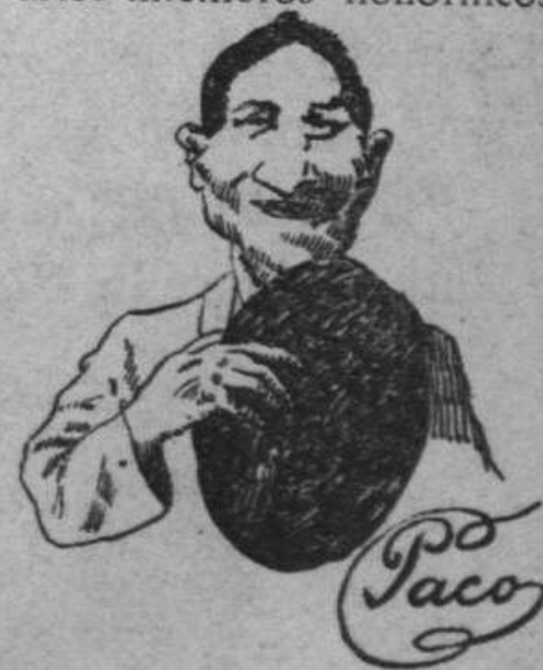
Dibujos de A. Seijo.

Francamente, aparte de algunas deficiencias, más ó menos morrocotudas, lo cierto es, que con estas reuniones, una doñita de espectáculos sui generis á gusto de nuestros populares empresarios de teatros y alguna que otra sesión shocking de nuestras dignísimas corporaciones populares, podremos ir sobrellevando, con resignación monástica, estas interminables veladas del invierno.