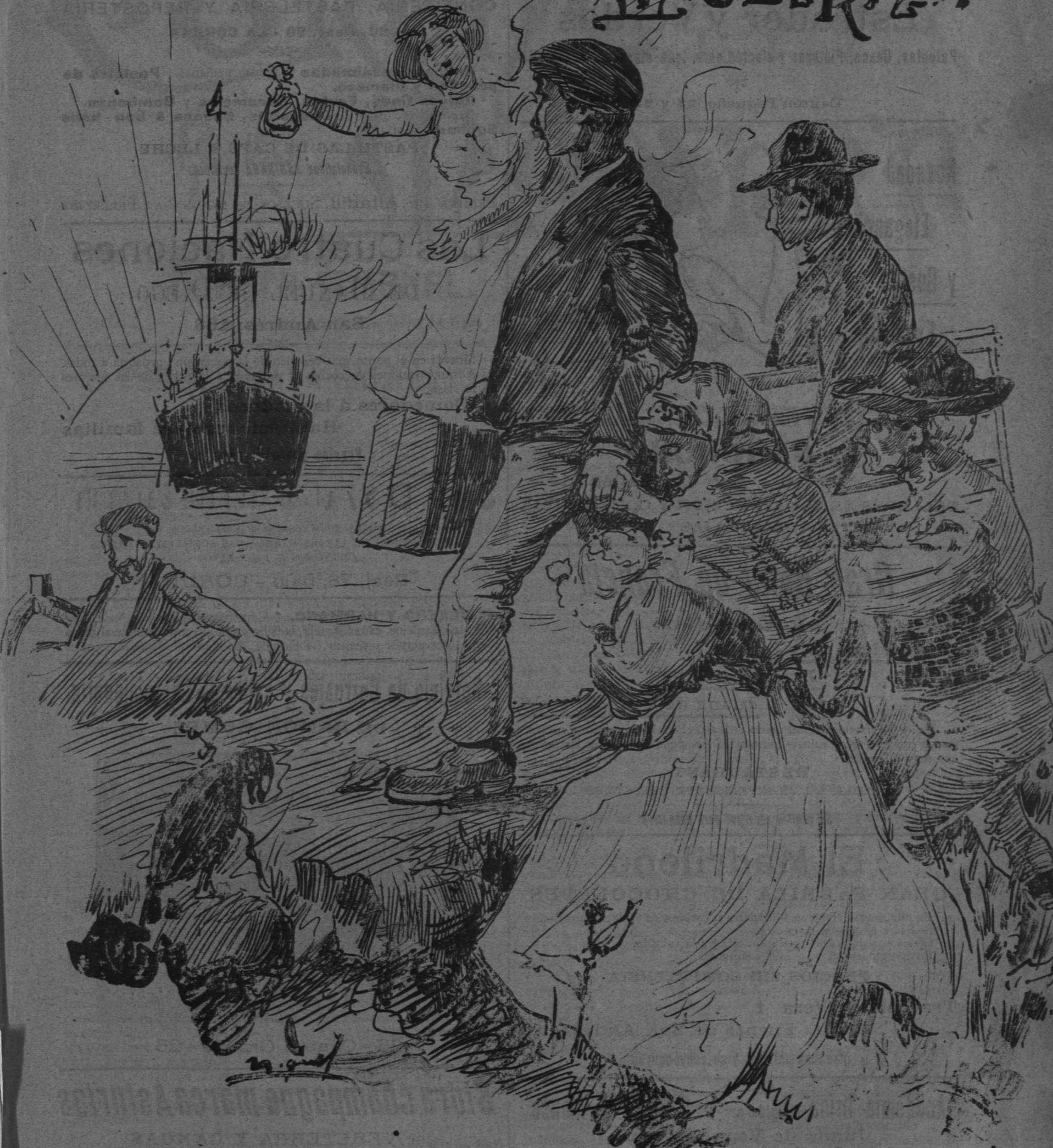
«La Emigración» DIBUJO DE M. MIGUEL