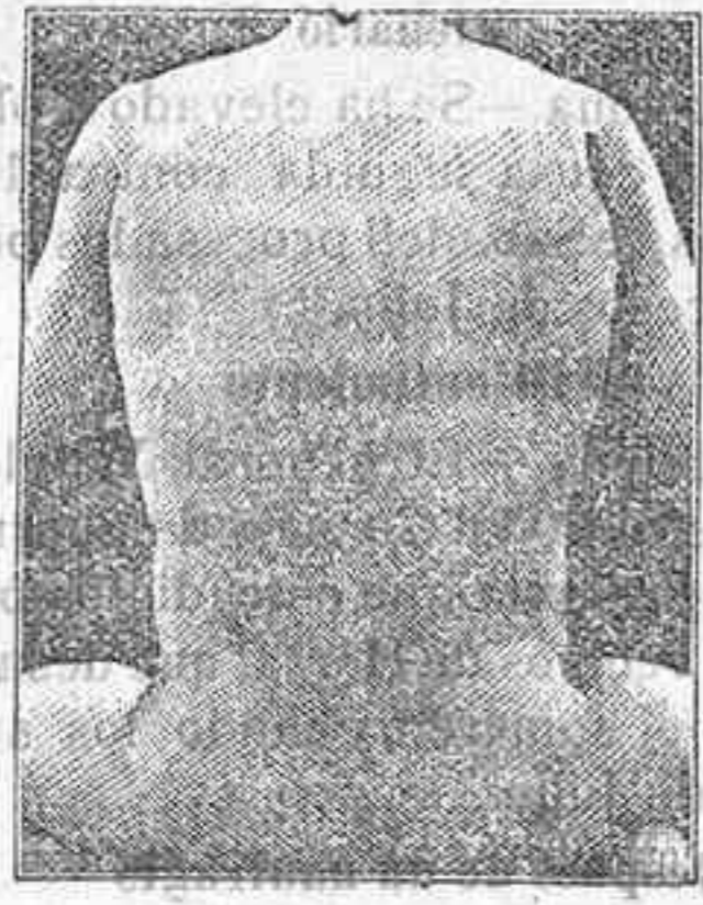
Antes de la curación.